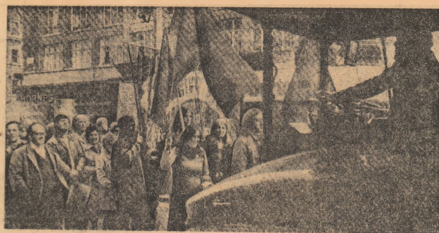
LONDRA: Aspect de la o demonstrație împotriva politicii economice a guvernului.

Participanții la Conferință au adoptat în scrisura prezidențială U. C. I., Ladu Ben Tio, în care, printre altele, se arată că Comisia U. C. I. va analiza în continuare activitatea Comisiei U. C. I. și a ajunge la