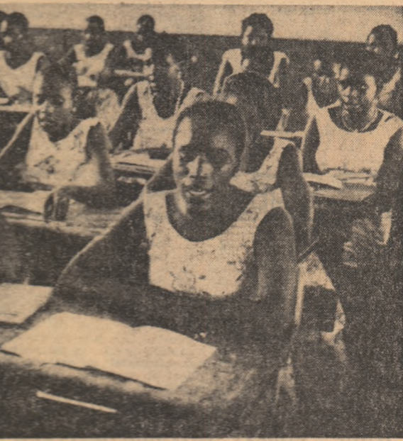
La o școală din Camerun: „Eforturi care trebuie sprijinite”.

— necesitatea sprijinirii țărilor în curs de dezvoltare, în primul rînd a celor din Africa și America Latină, pentru realizarea unui rapid progres al școlii. Este cu atât mai necesar cu cit aceste țări sînt confruntate cu o serie de probleme care împiedică dezvoltarea și creșterea școlii. Este cu atât mai necesar cu cit aceste țări sînt confruntate cu o serie de probleme care împiedică dezvoltarea și creșterea școlii.