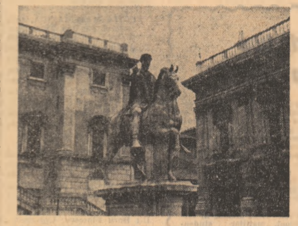
Iasemnari de A. I. ZĂINESCU

În partea istoria Egiptului. Și azi în Piața Poporului poate fi văzut un obelisc adus din țara piramelor de mare de împăratul Augustus. Obeliscul se înalță în Egipt încă de pe vremea faraonului Ramses. Statuile romane sînt replici, copii ale celor grecești, iar Zeus treacă marea a devenit Jupiter. Legenda întemeierii Romei are azi 2726 de ani și în ea au intrat deopotrivă oameni și decădere, culmi ale mîndriei și ortei. Au trecut vînturi — ostrogi, geti și lombrici — peste ea, strălucirea l-au fost deseori acoperită și întunecată dar timpul teazurizat care are infinite coordone de legătură cu lumea. Și vîrsta ei, a Romei, a devenit o înconfundabilă geografie a spiritului.