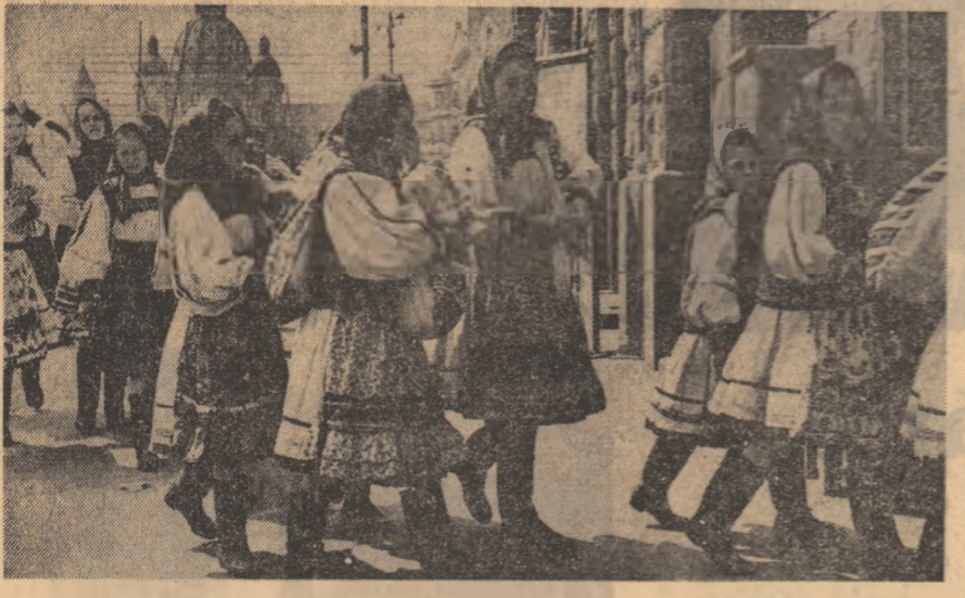
Tradiția se respectă în frumosul port popular.

CĂLIN STĂNCULESCU (Continuare în pag. a V-a)