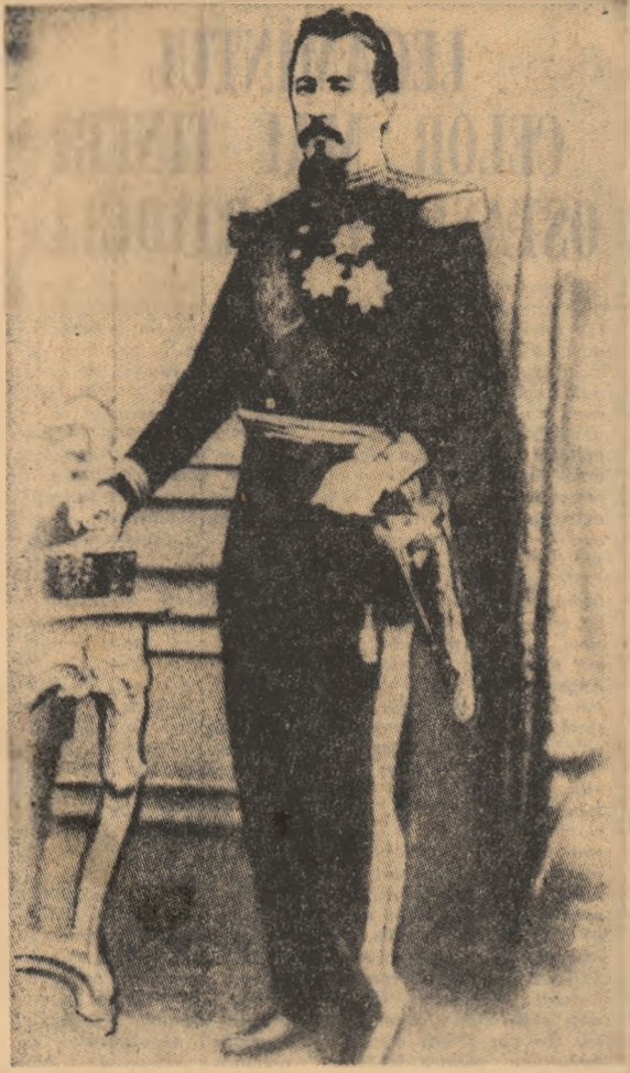
(Urmasa din pag. 1)

vreme el păstrează acest semn caracteristic al individualității sale, acest spirit de viață, el este investit cu dreptul nepreșciturii și-a trăi liber, unitatea națională este cheșășirea libertății lui, este trupul lui, trebuincios ca sufletul să nu piară și să amorțescă, ci din contră să poată crește și a se dezvolta... Unitatea națională fu visarea lăbită a velleozilor noștri cei viteji, a tuturor bărbații noștri cei mari, care intrară în sine individualitatea și cugețarea poporului, spre a o manifesta lumii”.