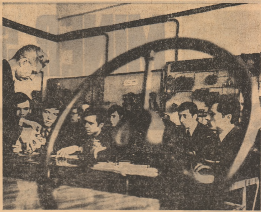
Elecți ai Liceului industrial de transporturi din București, în cabinetul de motoare și instalații unde împreună cu instructorul de specialitate studiază pe „cru” mecanismele unui agregat.