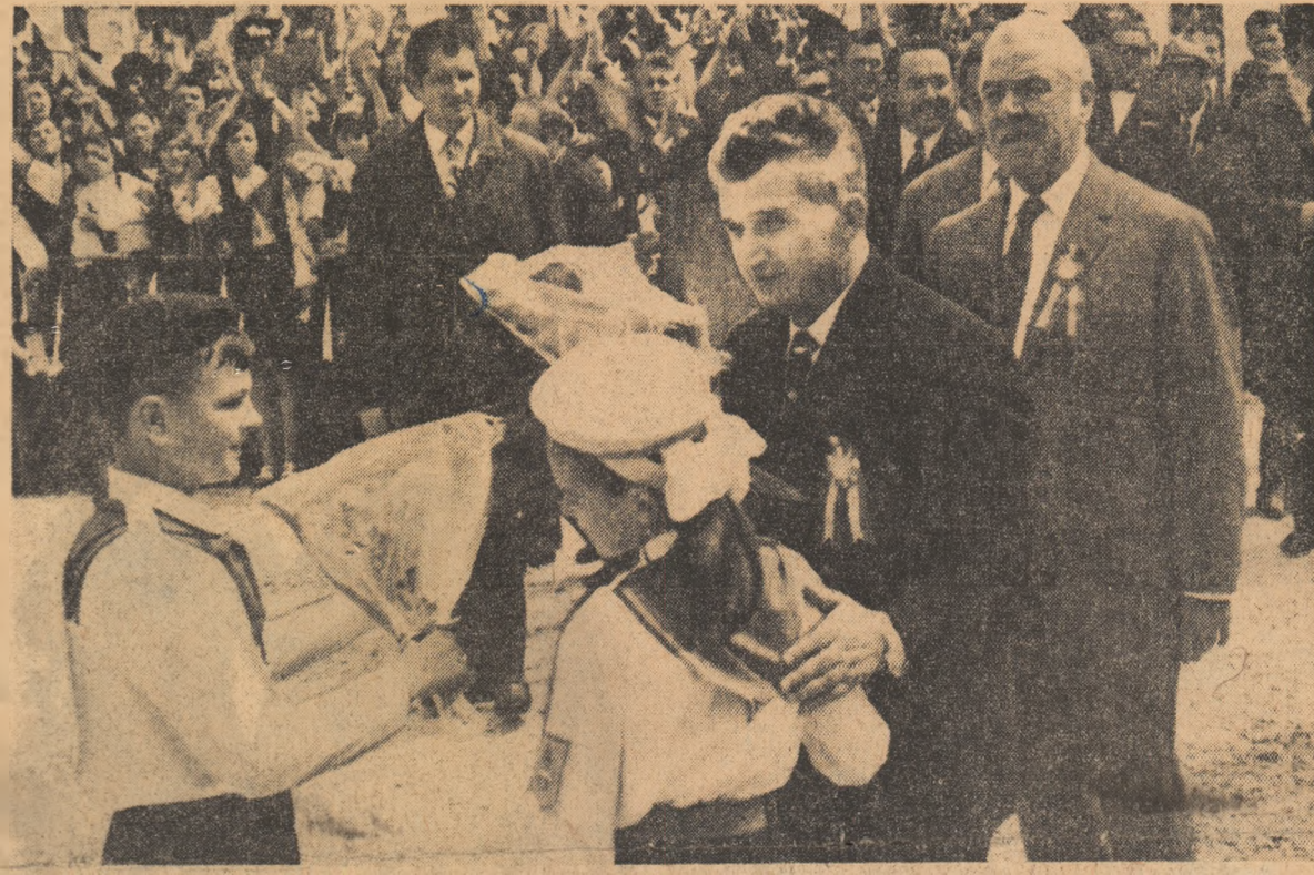
Ca peste tot, conducătorul tubit al partidului și statului nostru, este întâmpinat cu entuziasm și căldură.

● Acum ca și atunci, în acea memorabilă primăvară a lui 1848, cîmpia Blajului frează de lume ● Acum ca și atunci, se află, laolaltă, români, maghiari, germani ● Acum ca și atunci țara întreagă a trăit în aceeași comuniune de cuget și simțire ● Pe cîmpia Blajului, un nou jurămint: acela de a se înfăptui comunismul pe pămîntul românesc