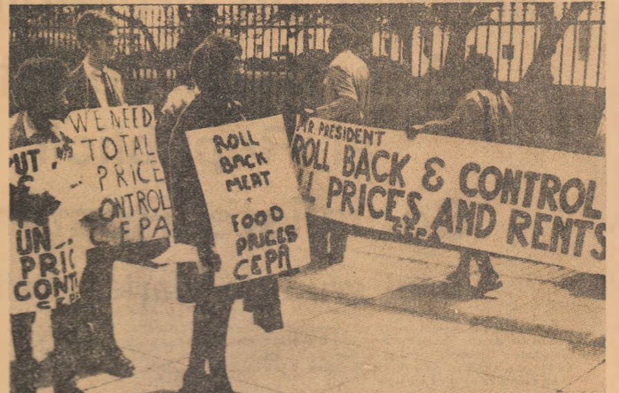
S.U.A. — Aspect de la o demonstrație a populației din New York împotriva creșterii continue a prețurilor produselor alimentare