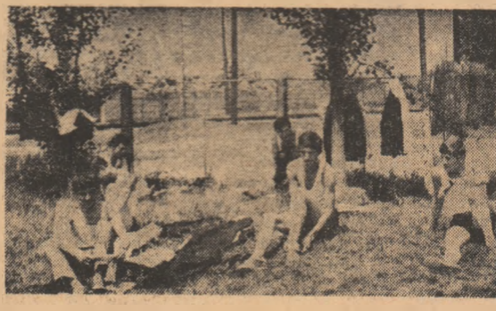
Eleoști (anul III E) se achiziționează pentru ora de educație fizică, dar profesorul nu vine (Grupul școlar poligrafic „D. Marinescu”).

Nu există o definiție prea exactă a educației fizice. În general, după specialiști, prin educație fizică se înțelege activitatea care valorifică sistematic ansamblul formelor de practicare a exercițiilor fizice în scopul mîinii, în principal, a potențialului biologic al omului, în speță al tînrului, în concordanță cu cerințele sociale. Care sînt aceste cerințe, în condițiile societății moderne, considerăm că nu mai e nevoie să subliniem în detaliu. E limpede, educația fizică, mișcare în aer liber, sportul ca preocupare cotidiană, contribuie direct și eficient la dezvoltarea fizică, fortificarea sănătății, sporirea capacităților pentru munca fizică și intelectuală. Un adevăr care, sperăm, nu mai trebuie demonstrat. Cu alte cuvinte educația fizică are în esență și un caracter formativ și educativ, în care rezidă, de fapt, rolul ei în procesul de învățămînt. Că aceste lucruri sînt înțelese, nu ne îndoiim, dar că nu se face totul pentru realizarea obiectivelor pe care și le propune această activitate socială, este un alt adevăr. Lucrurile capătă gravitate în momentul în care ne gîndim că cele două ore de educație fizică săptămînale, oricît de bine s-ar desfășura — avînd un conținut dens, variat — ele nu sînt indicate pentru a satisface nevoia de mișcare, de exercițiu fizic a populației școlare. Dar cînd nici aceste ore nu corespund cerințelor, lucrurile devin îngrijorătoare. (Pag. a III-a).