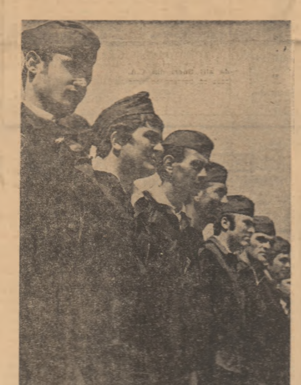
O mie de brigadieri s-au alinaț, sîmbătă, la cîmpul festiv de constituire a Șantierului național al tineretului din sistemul de irigații Cetate-Galicea Mare.

„Bun venit și spor în muncă” este, începînd de sîmbătă, salutul solemn a 1.000 de brigadieri angajați trup și suflet, pe această vastă hărnicie, cutezanță și entuziasmului, în patrioțica întrecere a uteciilor, pentru îndeplinirea înainte de termen