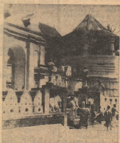
Furnale solare în Franța

O expresie a acestor bune relații este acordul bilateral de cooperare economică și tehnică, în baza căruia România participă la proiectarea și amenajarea unor exploantări forestiere în Sri Lanka, la construirea de drumuri și a unui combinat pentru industrializarea lemnului. În dezvoltarea ascendentă a relațiilor bilaterale un rol de seamă îl joacă schimbările de vizite la diferite niveluri, cu care ocazie s-a exprimat dorința ambelor părți de a extinde pe mai departe colaborarea reciproc avantajoasă.