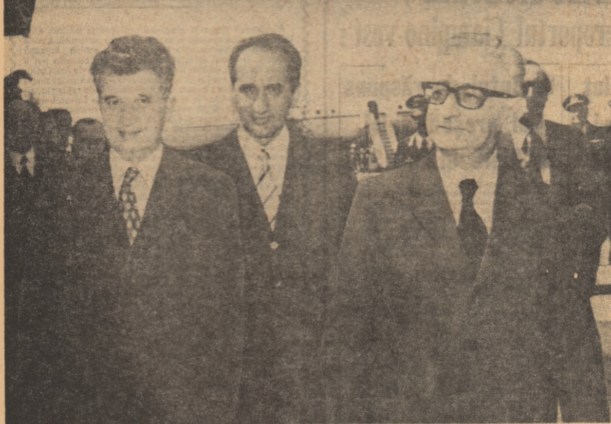
Reportajul vizitei: NICOLAE PUCEA, NICOLAE VAMU Revista presei: RADU BOGDAN

mun, ca constituie nucleul convorbirilor italo-române”, ziarul scoate în evidență acțiunile consecvent desfășurate de România în direcția înfrînării acestui deziderat, pentru transformarea Europei într-o zonă a păcii și înfrînării. „Datorită activității neobosite a lui Ceaușescu — scrie ziarul — pentru dezvoltare permanentă a relațiilor între state pe baza principiilor independenței și suveranității naționale — România și-a asumat un rol important în viața politică internațională”. Ziarele „L'UNITA” și „CORRIERE DELLA SERA” publică, de asemenea, diferite materiale consacrate vizitei. Întreaga presă relevă semnificația majoră a vizitei președintelui Consiliului de Stat nu numai pe planul relațiilor bilaterale, dar și al vieții internaționale în ansamblu. Cu puțin timp înainte de sosirea șefului statului român, în emisiunile radiofonice au fost prezentate biografiile tovarășului Nicolae Ceaușescu și diferite comentarii în legătură cu cursul favorabil pe care l-a urmat, în deosebi în ultimii ani, relațiile dintre România și Italia. Televiziunea italiană a transmis în direct sosirea la aeroportul Ciampino, precum și primirea la Palatul Quirinale. De asemenea, posturile de radio și televiziune au informat pe larg în emisiunile lor despre principalele manifestări ale primei zile a vizitei în Italia a președintelui Nicolae Ceaușescu.