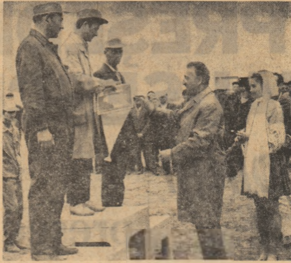
Aspect din timpul înmînării premiilor.