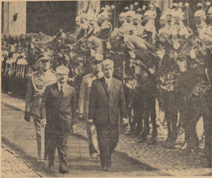
Relatarea primei zile a vizitei în paginile 2-3

Domnule președinte, Doresc, înainte de toate, să vă mulțumesc cu cordialitate pentru amabila invitație pe care mi-ați făcut-o de a vizita frumoasa dumneavoastră țară. Îmi face o deosebită plăcere să vă adresez dumneavoastră și simțite doamne Leone un salut călduros, și să aduc poporului italian prieten mesajul celor mai alete sentimente de stimă și considerație ale poporului român și ale mele, personal. Vizita pe care o începem, cu multă satisfacție, în țara dumneavoastră — expresie a bunelor relații dintre popoarele noastre ale căror izvoare milenare de afinitate sînt bine cunoscute — va deschide calea unei și mai rodnice colaborări multilaterale româno-italiene, în interesul propășirii ambelor țări. Sînt convins că vom găsi, toatădată, soluții pentru o tot mai eficientă conlucrare a României și Italiei pe plan internațional, în slujba idealurilor nobile ale prieteniei și colaborării între popoare. Animat de aceste gânduri, vă mulțumesc din toată inima, domnule președinte, pentru cuvîntele de bun venit, și imi exprim convingerea că vizita, convorbirile pe care le vom avea, înțelegerile la care vom ajunge, vor stimula extinderea și intensificarea colaborării româno-italiene, în interesul celor două popoare, al cauzei păcii și destinării internaționale.