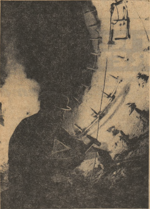
R.D. VIETNAM: Una din secțiile Fabricii de ciment din Haiphong, aflată într-un stadiu avansat de reconstrucție.

În ultimii cinci ani, aproximativ 23 000 de tineri și tinere au urmat școlile învățămîntului tehnico-profesional. În prezent, peste 50 la sută, din muncitorii au absolvit studiile medii.