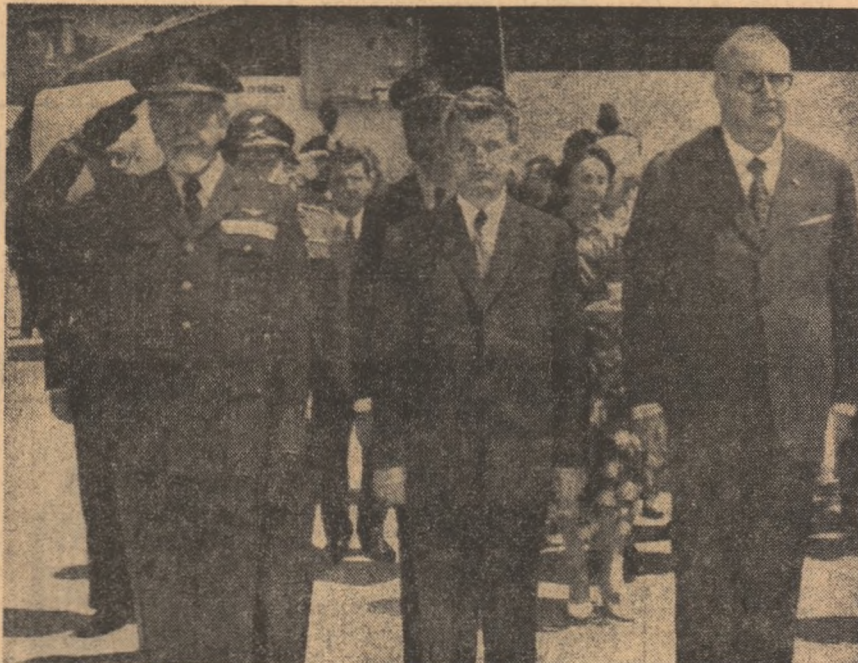
Întrearea la Genova

În acest interes deosebit pe care Italia l-a manifestat față de vizita dumneavoastră, noi vedem două aspecte: reinnoită prietenia frățească cu o țară prietenă, care are comune cu noi rădăcini ale limbii și culturii sale, și interesul care se concentrează în jurul operei dumneavoastră de om de stat, întrucât împliniți aspirațiile generale ce aparțin sufletului popoarelor, armonizând propria dumneavoastră orinduire socială cu principiile eterne și universale ale suveranității naționale, independenței, neamestecului în treburile interne — principii care constituie elementul esențial pentru o pace autentică între popoare, pentru progresul țării, mai ales pentru masa oamenilor care muncesc.