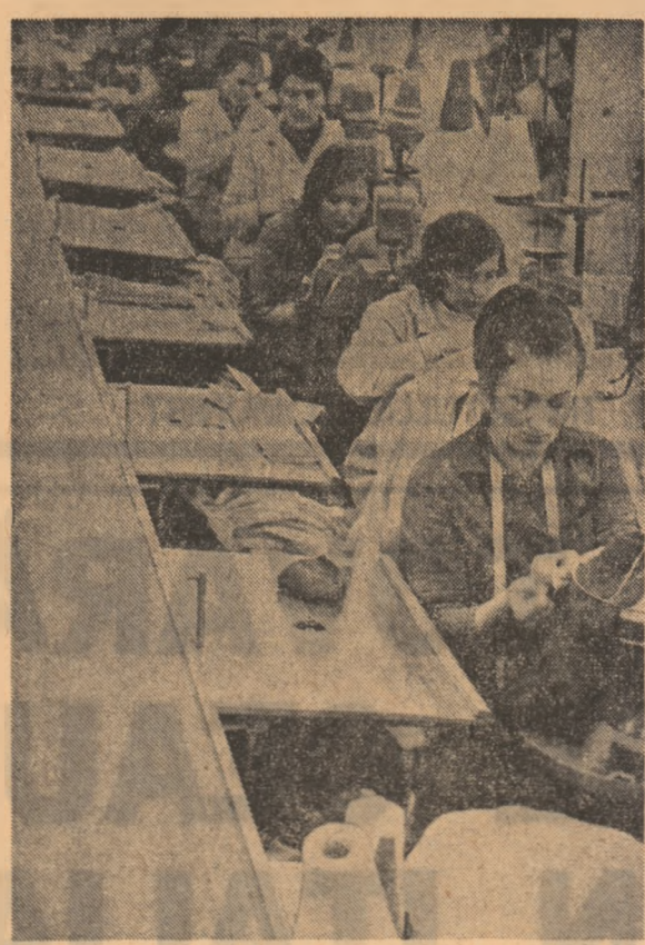
Secția confecții a Fabricii de tricotate din Miercurea Ciuc.

● În 8 ore o producție echivalentă cu 11 ore și 36 minute ● Timpul de integrare a unui noi angajat redus cu 76 de zile ● Producția de azi, totă minimă de atins pentru mine.