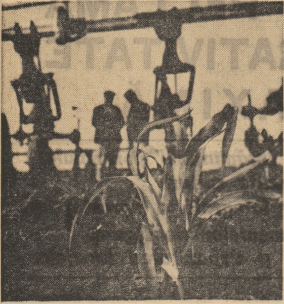
La cooperativa agricolă din Ciubaga, județul Dolj, toate forțele mecanice sînt concentrate acum la executarea lucrărilor de întreținere.