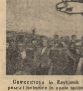
Demonstrație la Reykjavik împotriva pătrunderii vaselor de pescuit britanice în apele teritoriale ale Islandei.

Grupul pentru procedură a făcut un schimb de păreri cu privire la participarea la viitoare conferințe.