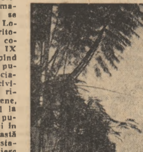
Însemnari de ROMULUS BENA

Asociația Tunisiană pentru Turism și Tineret desfășoară o rodnică activitate pentru punerea în valoare a uriașului potențial turistic al țării. Și potențialul este într-adevăr uriaș, căci trecerea de la clima mediteraneană din nord la cea deșertică din sud se face pe parcursul citorva kilometri, cu schimbări abrupte de la o oază la alta. Tunisia, capitala țării, atrage numeroși vizitatori în tot timpul anului: două orase, unul tipic arab, iar celălalt o implantare de stil european pe