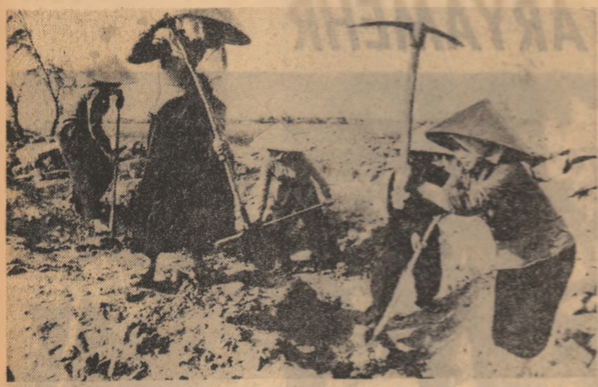
R.D. VIETNAM: Imagine de pe unul din numeroasele pontone de reconstrucție.