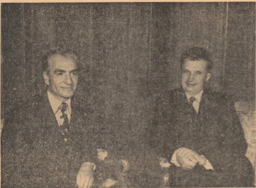
În timpul întâlnirii dintre cei doi șefi de state.

● La invitația președintelui Consiliului de Stat al Republicii Socialiste România, Nicolae Ceaușescu, și a tovarășei Elena Ceaușescu, simbăță la amiază au sosit în Capitală Maiestatele Lor Imperiale Mohammad Reza Pahlavi Aryamehr, șahinșahul Iranului, și Farah Pahlavi Șahbanu a Iranului ● Populația Capitalei a făcut o călduroasă primire înalților oaspeți, expresie a bunelor relații româno-iraniene ● În cursul zilei de simbăță au început convorbirile oficiale între președintele Consiliului de Stat al României, Nicolae Ceaușescu, și Maiestatea Sa Imperială, șahinșahul Mohammad Reza Pahlavi Aryamehr ● În aceeași zi, tovarășul Nicolae Ceaușescu și tovarășa Elena Ceaușescu au oferit, în onoarea înalților oaspeți iranieni, un dineu în timpul căruia cei doi conducători de state au rostit toasturi ● Duminică, vizita a continuat cu o călătorie în nordul Moldovei, în județele Suceava și Neamț