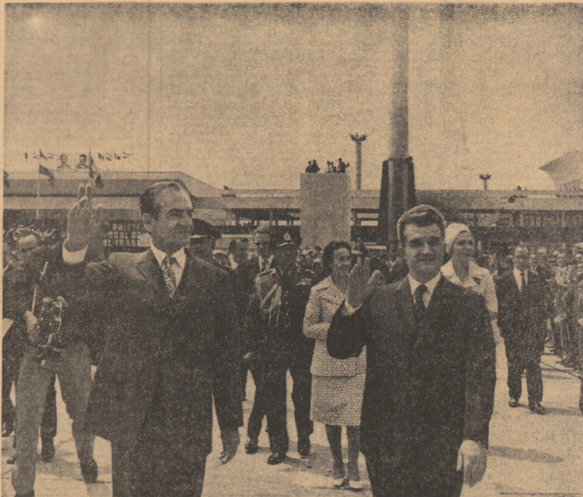
La sosire, pe aeroportul internațional Otopeni.

(DIN TOASTURILE ROSTITE SIMBĂȚA, 2 Iunie, LA DINEUL OFICIAL)