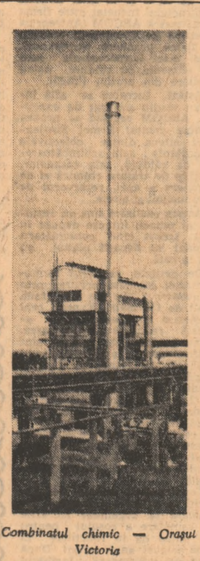
Combinatul chimic — Orașul Victoria