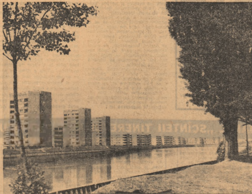
Noul cartier de locuințe „Spaiul Crișanei” din Oradea.