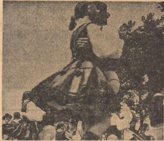
Formația de dansuri a căminului cultural din Lunca de Jos, județul Harghita.

revoționară, părăsindu-și casa și locul de muncă și s-au alăturat guvernului provizoriu. Remanent și lărgit după sosirea în Capitală a tuturor conducătorilor revoluției, guvernul și-a exercitat timp de peste trei luni de zile conducerea efectivă a Tării Românești, până la intervenția brutală, contrarevoluționară, a trupelor Imperiului Otoman. În toată această perioadă, programul de la Islaz a repre-