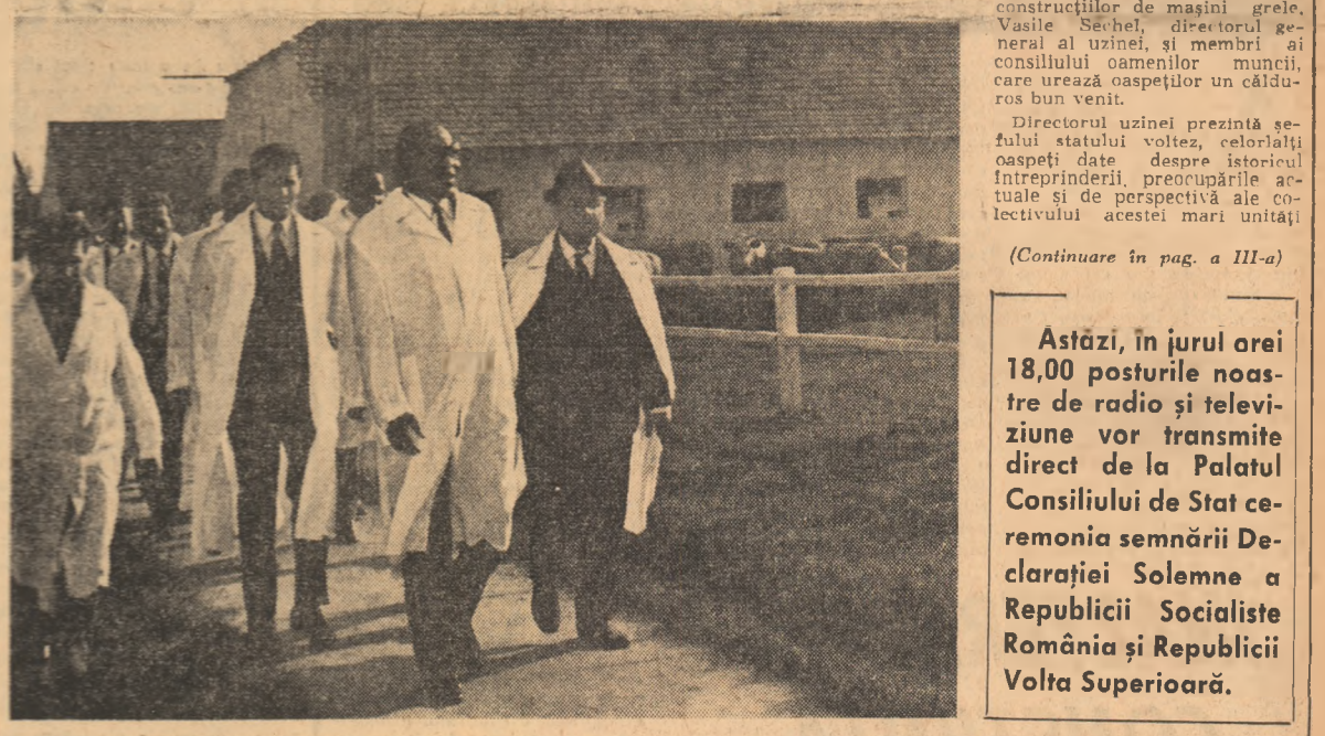
(Continuare în pag. a III-a)