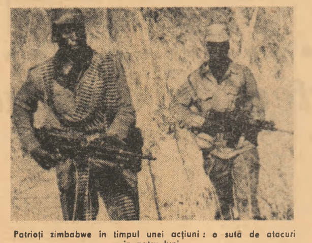
Patrioți zimbabwesi în timpul unei acțiuni: o sută de atacuri în patru luni...

În cadrul sesiunii de vară a Consiliului Guvernatorilor Agenției Internaționale pentru Energie Atomică (A.I.E.A.), care și-a desfășurat lucrările în capitala Austriei, reprezentantul României, prof. Ioan Ursu, președintele Comitetului de Stat pentru Energia Nucleară, vicepreședinte al Consiliului Guvernatorilor, a subliniat necesitatea elaborării unui instrument internațional care să stăteze principiile cooperării internaționale în domeniul utilizării energiei atomice în scopuri pașnice. Delegația română a apreciat, totodată, că, în condițiile creșterii sarcinilor A.I.E.A. în domeniul garanțiilor, este necesar ca agenția să-și intensifice eforturile și să-și sporească resursele ateleate transparenței în practică a funcției sale statutare principale, de dezvoltare a aplicațiilor pașnice ale energiei atomice în folosul tuturor statelor, asigurîndu-se astfel un echilibru rezonabil între activită-