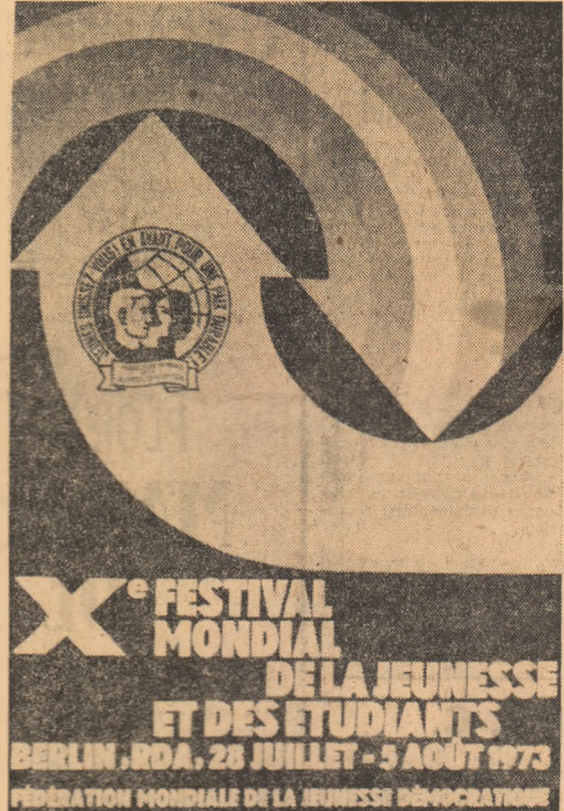
Afiaș editat de Federația Mondială a Tineretului Democrat și al Studenților care se va desfășura la Berlin.