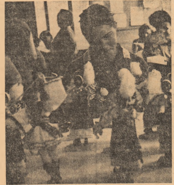
Printre „miinile îndeminate” ale făuritoarelor de păpuși folclorice de la Cooperativa „Arta-Crișana” din Oradea.