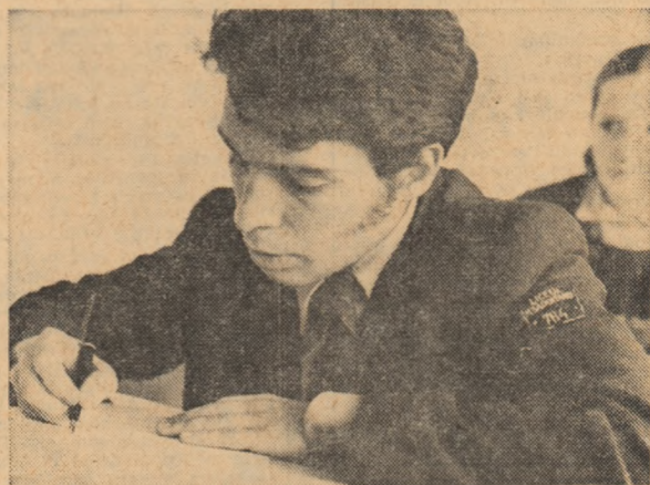
BACALAUREATUL. Promoția 1973 a liceelor noastre — 100.000 de tineri — a început ieri examenul de bacalaureat cu lucrarea scrisă la literatura română. Tuzorilor candidaților „succes” în acest examen care le finalizează studiile liceale.