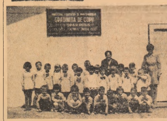
Profund de citeza clipa în care soarele și spari plafonul noilor, am imortalizat pe peliculă grupul celor mai mici dintre locatarii coloniei Fintinele, locul de a peste 1.200 metri altitudine...