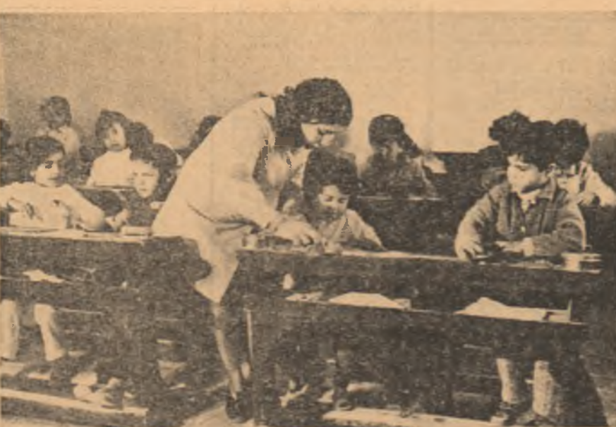
TUNISIA: Elevi de la o școală primară din orașul-port Sousse.