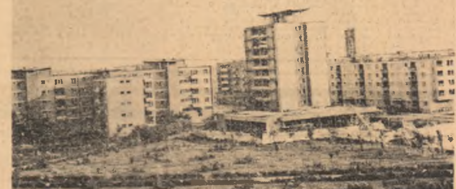
Noi construcții de locuințe la Baia Mare.

de sub apă a cîinci sute de hectare din cel mai productiv teren afectat de revărsarea Olteului. Pe dealurile Olteului, la Bugulești, Lăcusteni și Bălești tinerii au plantat vie. Mai bine de o sută de mii de buciți, s-au terasat pentru a corectarea de sub apă a cîinci sute de hectare din cel mai productiv teren afectat de revărsarea Olteului. Pe dealurile Olteului, la Bugulești, Lăcusteni și Bălești tinerii au plantat vie. Mai bine de o sută de mii de buciți, s-au terasat pentru a corectarea