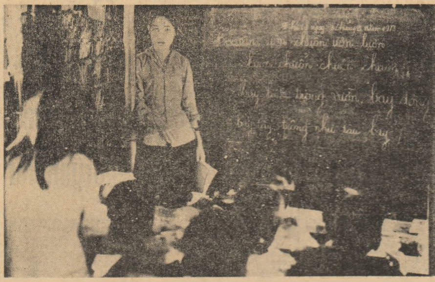
Oră de curs la o școală dintr-una din zonele de sub controlul Guvernului Revoluționar Provisoriu al Republicii Vietnamului de Sud.