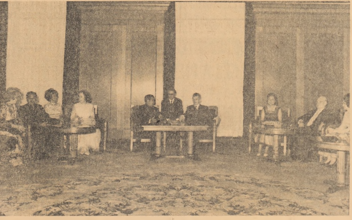
Aspect din timpul vizitei protocolare.

Doresc, în încheiere, să adresez cititorilor ziarului dumneavoastră și întregului popor din Republica Federală Germania cele mai bune urări de prosperitate și pace.