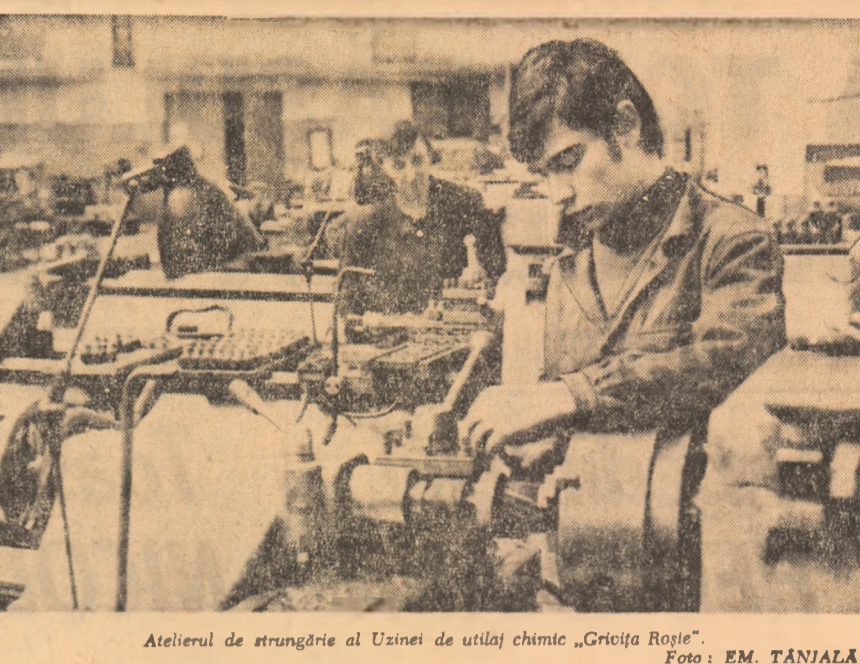
Atelierul de strungărie al Uzinei de utilaj chimic „Grișia Roșie”.