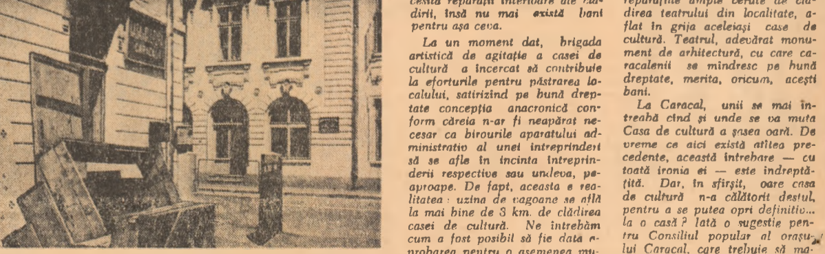
A fost înrepută a cincea mutare. Deocamdată, din clădirea „gazdă” se readuc peste drum, la casa de cultură, cîțiva... suporți de lemn.

În seara cînd am sosit la Caracal, ne-am oprit la Casa de cultură a orașului. La intrare, un panou uriaz, cu programul de activități la stînga și la dreapta, ne-a primit. Dar... pe toate ușile, lacde. În schimb,