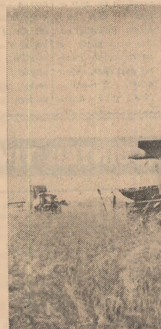
În aceste zile de seceriș pe ogarele I.A.S. Biharia.