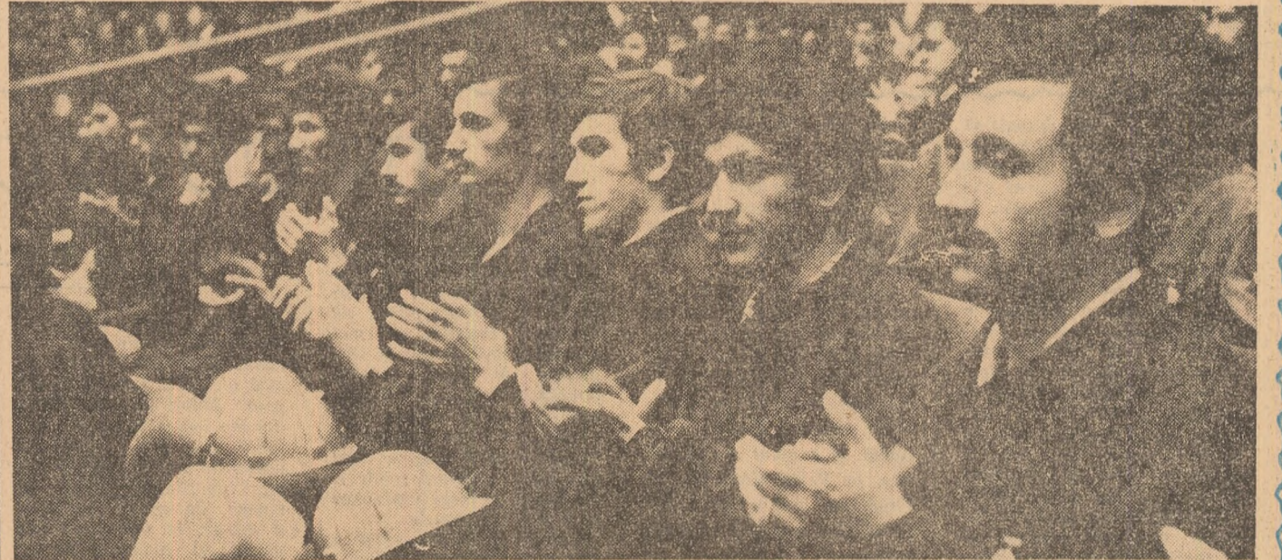
Însufleșiți de mobilizatoarele îndemnul adresate de secretarul general al partidului, continuatoarii nobilelor tradiții de muncă născute în bătălia reconstrucției pe Șantierele naționale ale tineretului de acum 25 de ani, brigadierii de azi — întreaga generație tânără a patriei — și-au reinnoit, ieri, legămîntul solemn de a participa tot mai activ la întrecerea patriotică a întregului popor, pentru realizarea cincinalului înainte de termen, pentru progresul neîntrerupt al României socialiste.