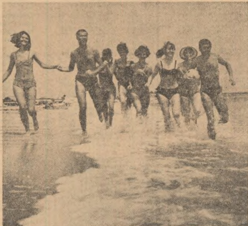
Apă, soare, tinerețe — trei componente ale vacanței.

Alerg Vreau să-mi opresc prin inimă Gîndurile. Vreau să le țin în cupele minții Și să le răstorn, mereu — în mișcare Ridic brațe albe soarelui Și o dată cu ele Sentimentele Le string într-un singur buchet Și le dăruiesc cerului, Vrînd să-i ating lumina Dar mă zgîrii în stele, Și, atunci, îmi caut refugiul În inimile oamenilor. DORINA CELIA CACOVEANU elevă, Școala generală nr. 203