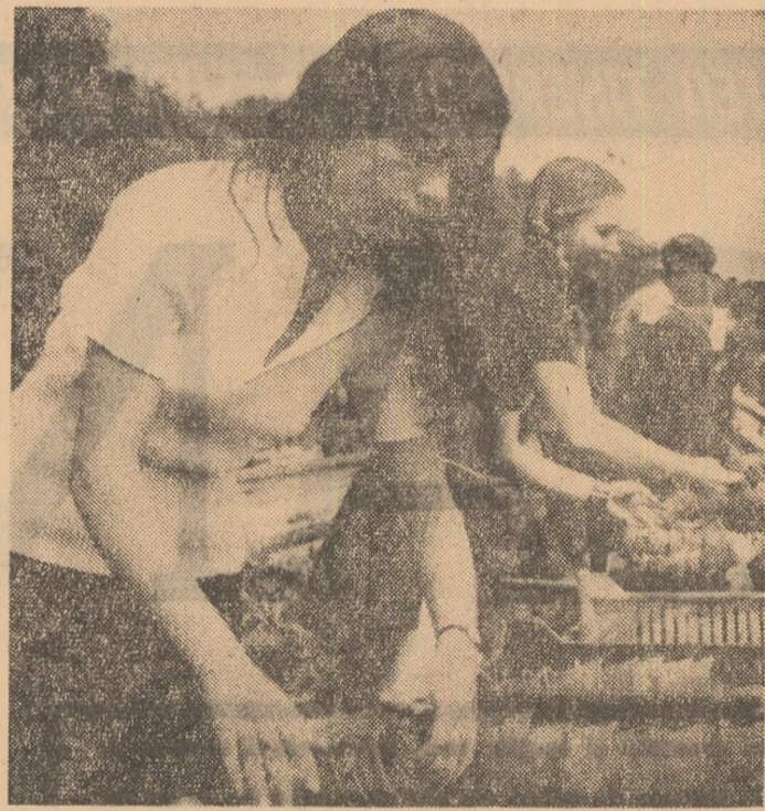
La Ferma nr. 5 Buftea elevii lucrează la răsadnițe.

Baza nautică, complexul de terenuri sportive, biblioteca și centrul de informare politică, jocurile de sală asigură tuturor vizitatorilor Complexului Tei, petrecerea unor ore plăcute în aer liber.