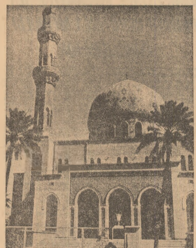
Însemnări de EUGEN FLORESCU

În comparație cu starea de mizerie moștenită îndeosebi în sate, realizările se dovedesc, deja, remarcabile. Bagdadul, capitala țării, a dat un prim exemplu luînd pentru atîrnarea cartierelor de lut din împrejurimi, pentru construirea de locuințe care să ofere condiții umane cetățenilor săi. Impresionantă, de asemenea, este tendința de aplicare a unor cunoscute principii socialiste de dezvoltare a economiei după naționalizarea marilor companii străine și în special crearea unei baze industriale proprii. În acest efort, primii chemați sînt tinerii. Politica statului, favorabilă tineretului, are în special două ținte — sănătate și cultură. Le-am văzut pe strănepoatele frumoase Șahrazada alături de frații sau prietenii lor în bibliotecă și laboratoare de chimie, de inginerie sau medicină înfăptuind astfel una dintre lozincile lor favorite — „Tinerul — gata oricînd!"