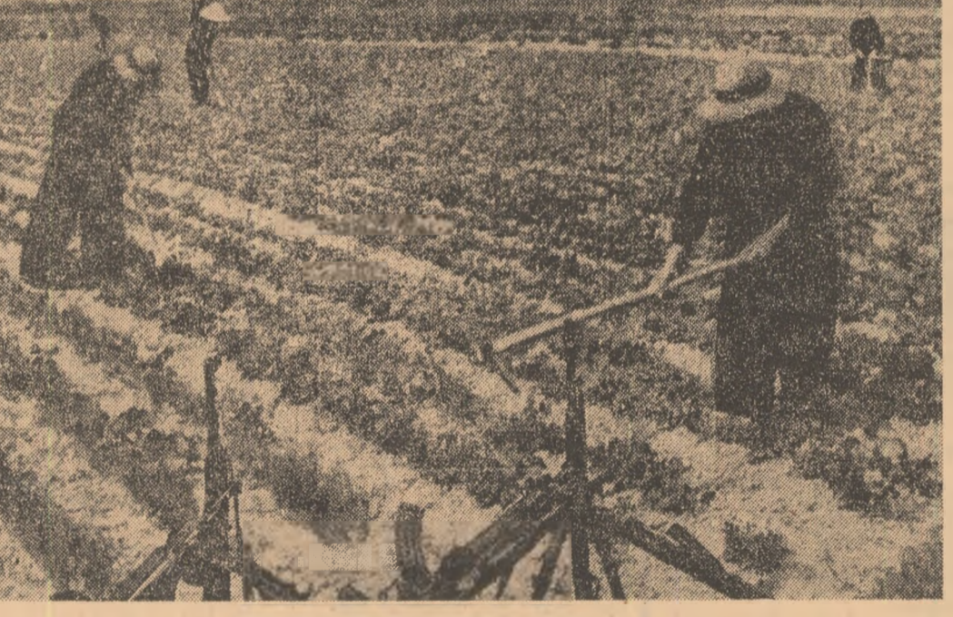
VIETNAMUL DE SUD. — Locuitori din zona eliberată Gio Linh, provincia Quang Tri, la lucrările de întreprindere a culturilor.

Tovarășul Paul Niculescu-Mizil, vicepreședinte al Consiliului de Miniștri al Republicii Socialiste România, ministrul educației și învățămîntului, care a făcut o vizită oficială în Algeria, a încheiat, vineri, convorbirile cu ministrul algerian al învățămîntului superior și cercetării științifice, Mohamed Seddik Benyahia, prin semnarea unui protocol cuprinzînd măsuri pentru dezvoltarea colaborării între România și Algeria în domeniul învățămîntului superior și cercetării științifice.