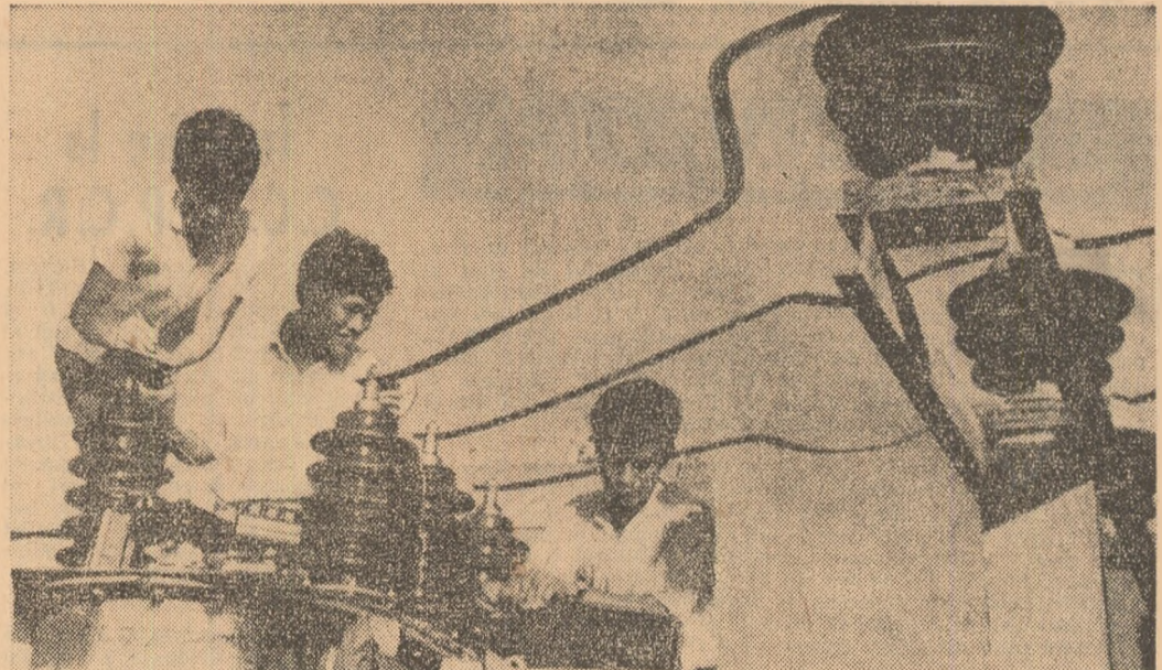
R. D. VIETNAM: Studenți de la Facultatea de electrotehnică din cadrul colegiului de mecanică și electricitate din Hanoi, ajutând la repararea transformatorilor stației de pompare Hun Bi.

În document se arată că acordul realizat este fructul unui dialog serios între Partidul Baas și P.C. Irakian, și constituie „baza pentru acțiunea în cadrul unui Front Național Progresist”. Desfășurarea mișcării revoluționare în Irak — adaugă comunicatul — „a scos în evidență importanța deosebită a alianței și cooperării forțelor revoluționare în cadrul unui front unitar”. Totodată, cele două țări subliniază că „Frontul Național Progresist reprezintă o necesitate în vederea rezolvării problemei kurde”, considerând că se impu-