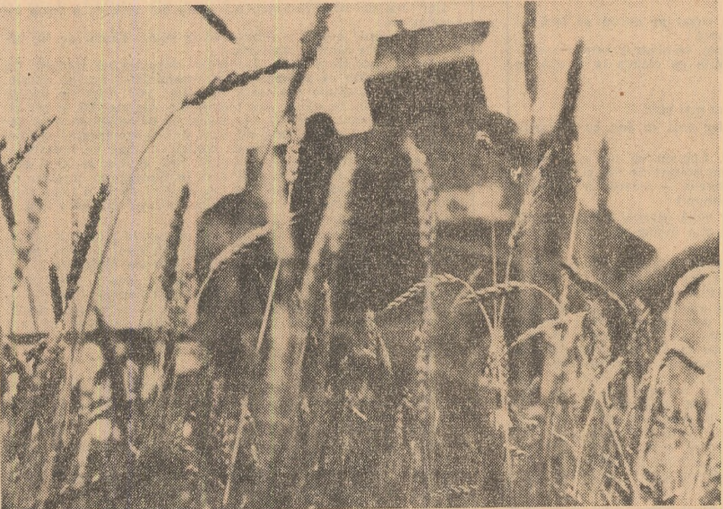
Secerișul grîului la C.A.P. Pădureni, jud. Timiș