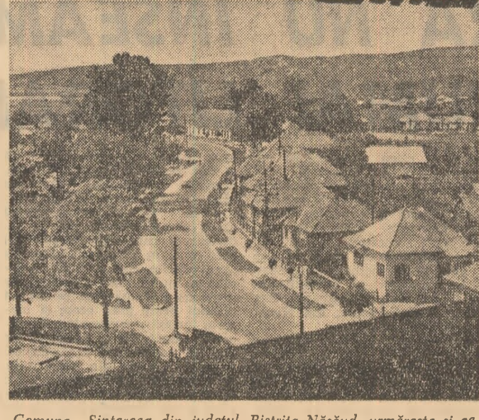
Comuna Sintereag din județul Bistrița Năsăud, urmărește și ea prefacerile urbanizării.