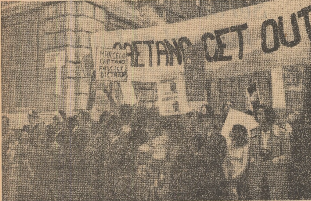
LONDRA: Dezvăluirile privind opinia publică britanică. În masacrul colonialiștilor portughezi din Mozambic au indignat timpul vizitei premierului Caetano în Anglia au avut loc puternice manifestații de protest.

În sfîrșit, o altă categorie de savanți interpretează datele și fotografiile transmise de stațiile automate ca indicînd faptul că Marte este un astru pe care viața este abia pe punctul de a se naște. S-ar putea ca noua sondă automată sovietică „Mars-4” lansată la 21 iulie să permită o incursiune mai profundă în enigmele lui Marte. Decodămă sîntem încă în studiu în care indicile obținute din desfășurarea programelor „Mars” și „Mariner” sînt dublate de un mare număr de noi semne de întrebare. Misterele planetei roșii rămîn întregi.