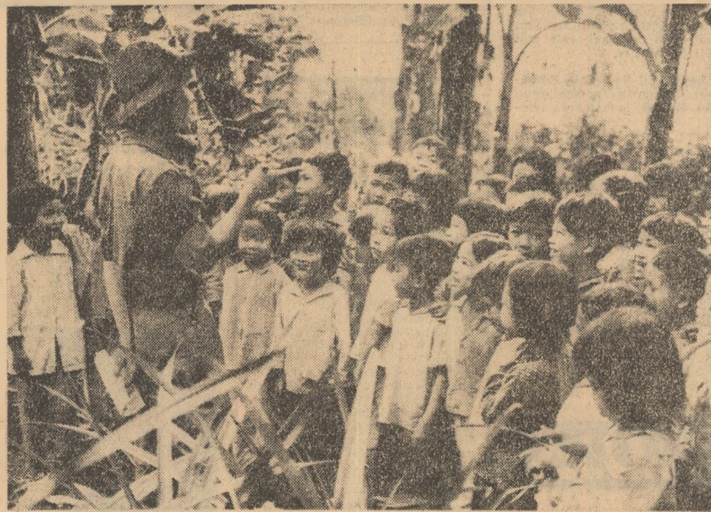
IN ZONA ELIBERATĂ DIN VIETNAMUL DE SUD: Un luptător al forțelor patriotice stînd de vorbă cu un grup de copii și tineri din provincia Quang Tri, cărora le relatează despre faptele de eroism ale ostașilor armatei de eliberare.