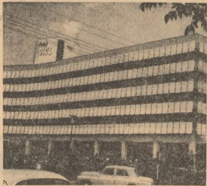
Noul hotel „Jiu” din Craiova.