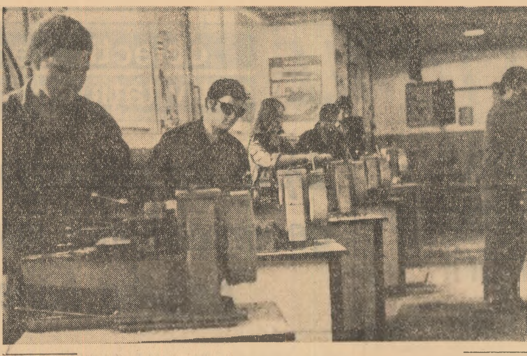
Un an de învățatură încheiat cu o fructuoasă perioadă de vacanță. Studenții după ce au trecut examenul producției, se vor bucura de meritată VACANȚA.

Între 11 și 18 septembrie: a șasea ediție a