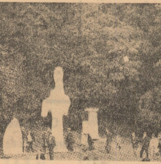
Situată la circa 35 de km de Buzău, într-un splendid peisaj montan...