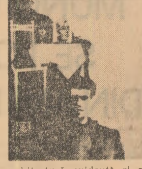
D. MATALE LOCUL