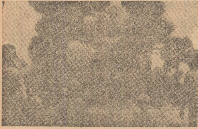
Agentele de presă anunță, referindu-se la un comunicat al comandamentului trupelor lomonosov, că, în noaptea de luni spre marți, forțele patriotice au reușit să pătrundă, pentru a treia oară consecutiv, în peninsula zonei de apărare a Pnom Penhului, la numai zeci de kilometri de centrul orașului.

De la trimișii noștri BAZIL ȘTEFAN, GH. SPRINTEROIU, DRAGOMIR HOROMNEA