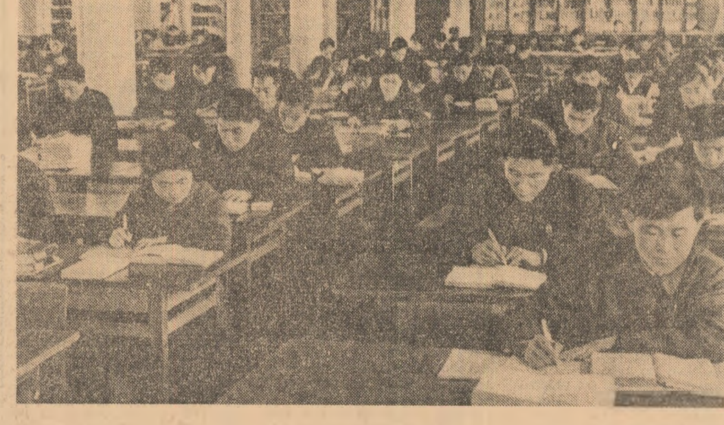
În R.P.D. Coreeană cunoaște o largă răspîndire rețeaua bibliotecilor. În fotografie: sala de lectură a Bibliotecii Naționale.

În ciuda îmbunătățirii condițiilor astronautilor, prima ieșire în spațiu a fost din nou amînată, fiind programată — se pare definitiv — pentru ziua de sîmbătă. Între timp rămăsese în discuție pentru refacerea condițiilor fizice a astronautilor, dar și pentru reactivarea unor sisteme de la bordul laboratorului „Skylab”, decuplate de primul echipaj al acestei misiuni. Printre operațiunile ce vor fi efectuate sîmbătă în afară navei figurează, între altele, încărcarea aparatelor speciale folo cu filme noi și asigurarea unui alt sîrut protector împotriva razelor solare asupra regiunii avariate în timpul lansării navei.