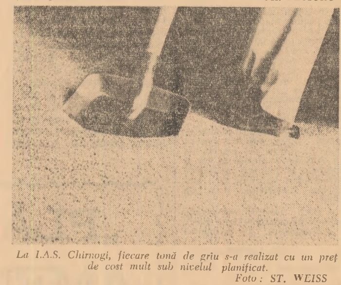
La I.A.S. Chirnoși, fiecare tonă de grâu s-a realizat cu un preț de cost mult sub nivelul planificat.

Județele Olt și Teleorman au încheiat secerișul. În cursul zilei de ieri, alte două județe, Olt și Teleorman, au încheiat campania de recoltare a păioaselor. Cu acest prilej, comitetele județene de partid au adresat C.C. P.C.R. tovarășului Nicolae Ceaușescu, telegrama prin care lucrătorii din agricultura celor două județe se angajează să nu-și preocupă eforturile pentru a contribui la succesul în înfrățirea cincinalului înainte de termen.