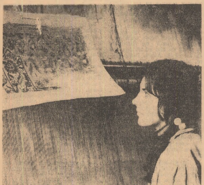
O ultimă privire asupra modelului...