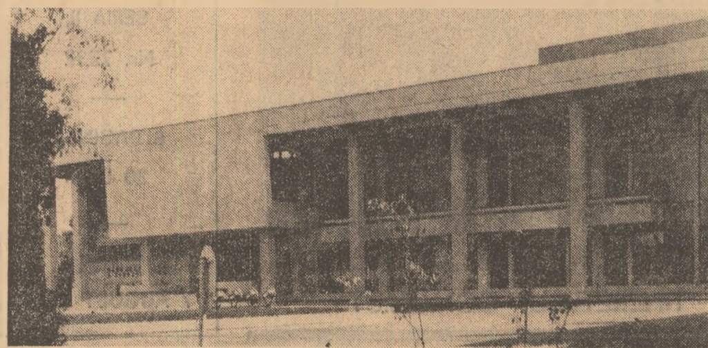
Casa de cultură din Alexandria.