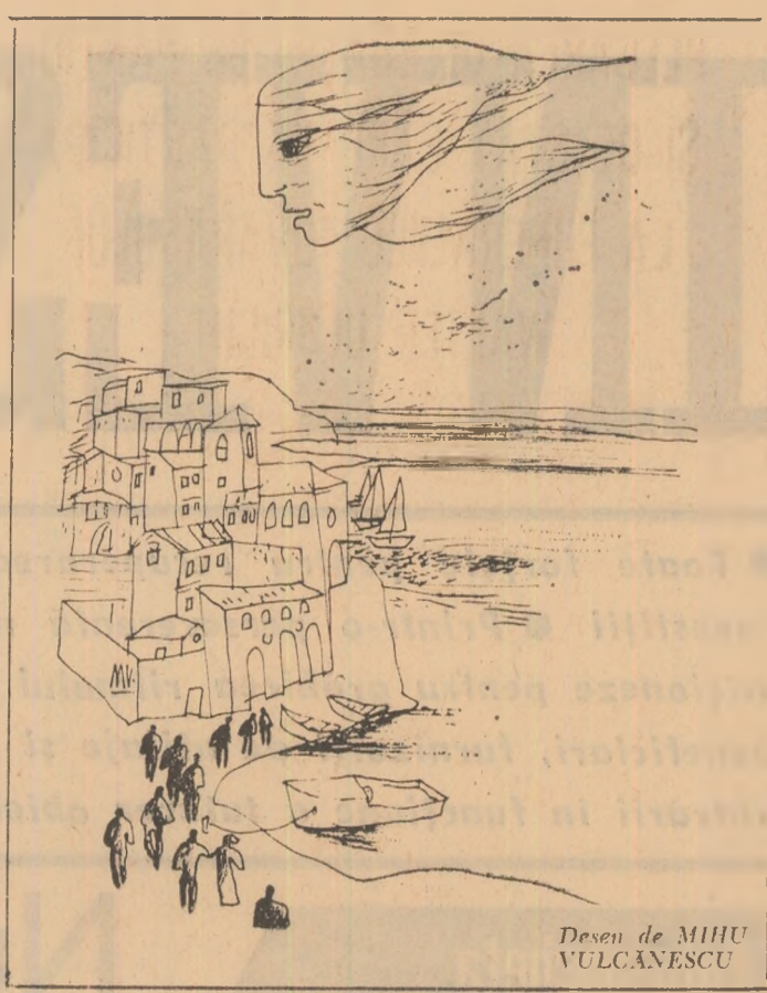
Desen de MIHU VULCĂNESCU