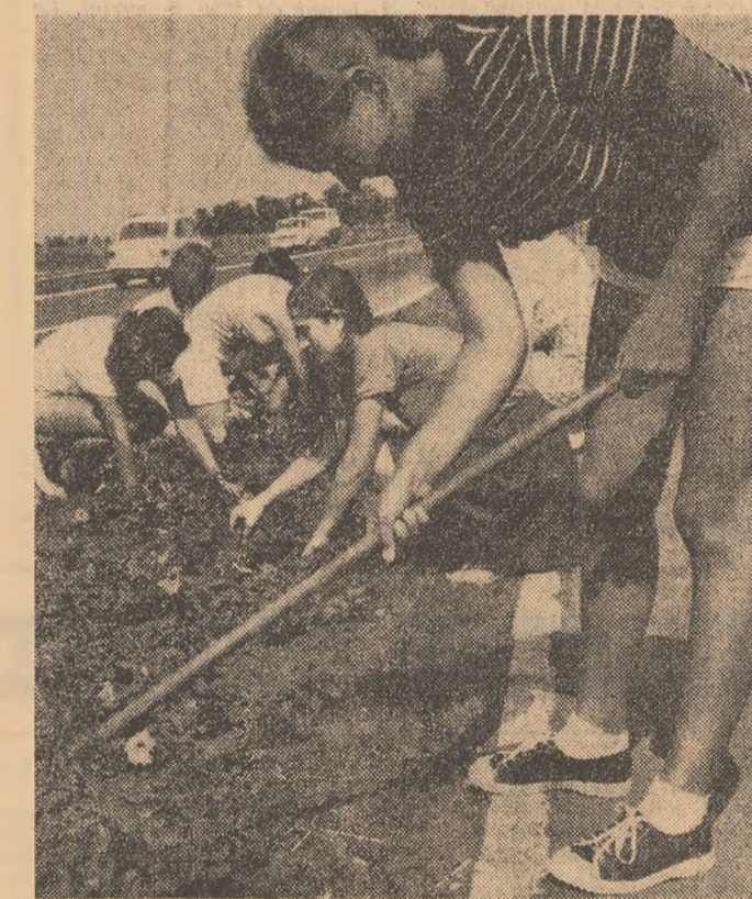
Elevii Liceului nr. 6 din Ploiești — „grădinarii ai orașului“. În timpul vacanței zilnic numeroși elevi ajută la plantatul și plivitul florilor, la întreținerea spațiilor cerii. Lată-i pe cîteva dintre ei plivind florile de pe marginea șoselei de la intrarea în oraș.

sată tinerilor satului, alții cîși sînt, Sibiu arînd un număr record de tineri lucrători în unitățile agricole, vizează antrenarea acestora în mod deosebit la grăbirea lucrării sus-amintite. Cum s-a răspuns? Un unanim prezent, nu numai de la cei care lucrează în agricultură, ci și de la elevii și studenții sosiți în vacanță, de la tinerii muncitori aflați în concediu, acasă. Peste 25 de formații uteciste, cuprînzînd între 15—30 membri fiecare, ac- OCTAVIAN MILEA (Continuare în pag. a II-a)