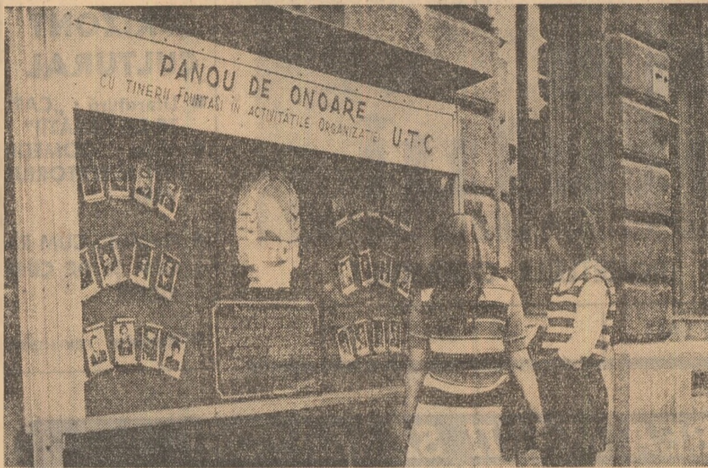
Instantaneu din Arad.