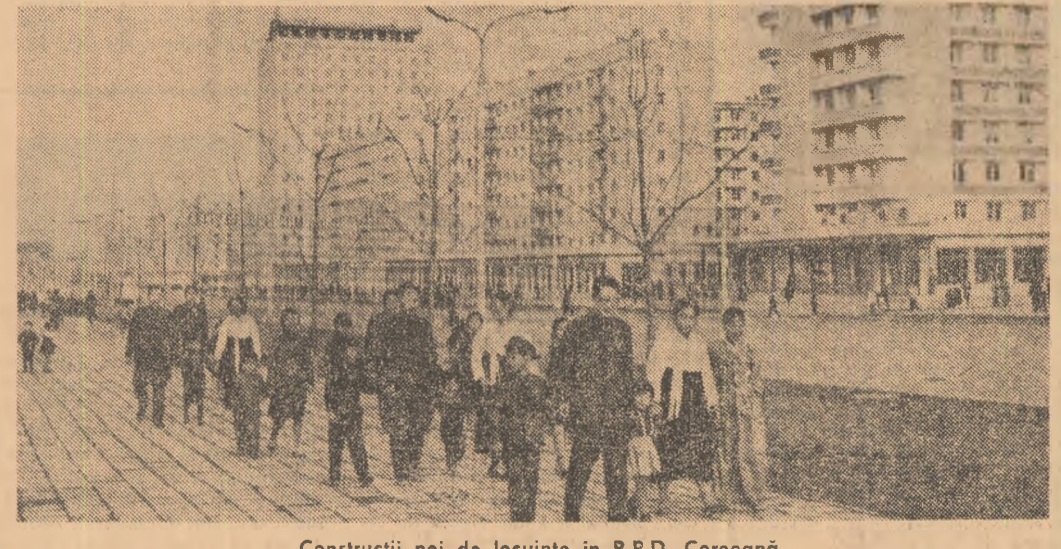
Construcții noi de locuințe în R.P.D. Coreeană