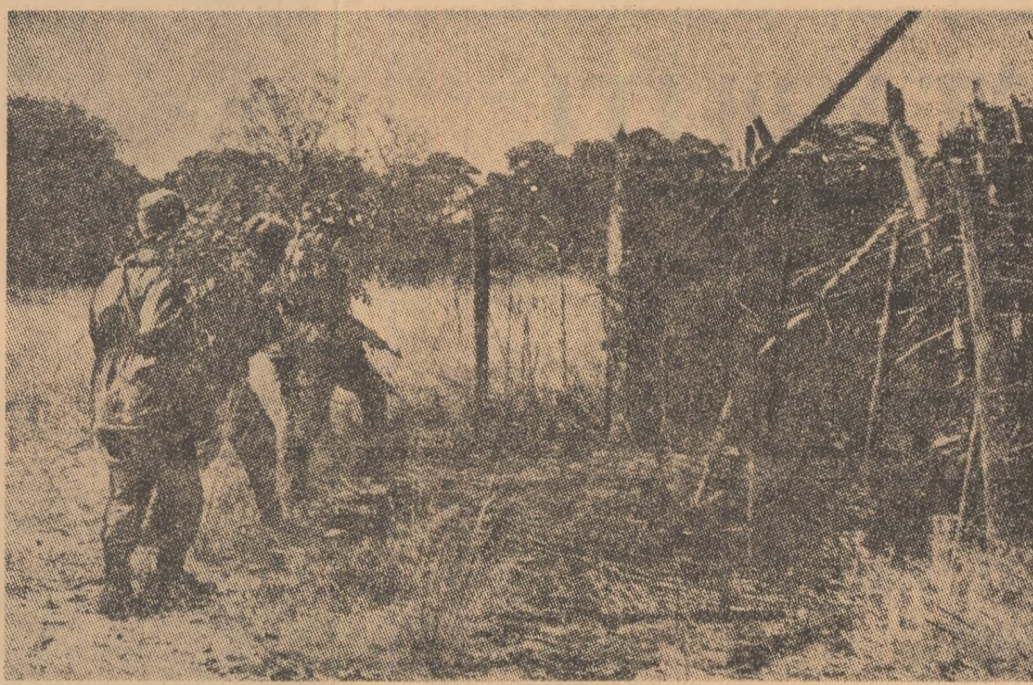
Patrioții angolezi în timpul unei misiuni de luptă.

Grupul țărilor africane ale Commonwealthului a alcătuit un plan în legătură cu problema regimurilor răsiste din Africa de Sud și Rhodesia. Acest plan preconizează între altele, că Marea Britanie trebuie să intervină pentru a obține eliberarea tuturor prizonierilor politici din Rhodesia și să ia măsuri pentru respectarea sancțiunilor și extinderea acestora la transporturile aeriene, poștale și telecomunicații. Se prevede, de asemenea, ca membrii Commonwealthului să ceară acelor țări care mențin relații economice cu Africa de Sud să reducă treptat aceste relații. Totodată, guvernele țărilor membre trebuie să ceară aliaților Portugalia și să nu mai acorde sprijin politic colonialist de acestei țări în Africa. Documentul prevede, totodată, necesitatea ca guvernele țărilor membre ale Commonwealthului să acționeze în cadrul O.N.U. pentru izolarea neîntinzată a problemei Namibiei.