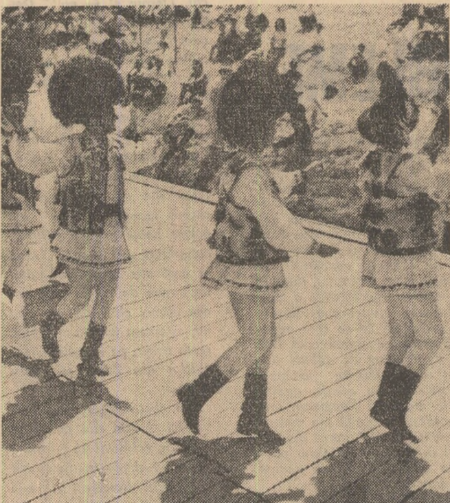
„SĂRBĂTORAREA HOLDELOR” — sărbătoare a celor peste 20.000 de cooperatori și mecanizatori care au obținut victoria pe întregul „front al grîului” din județul Ilfov.