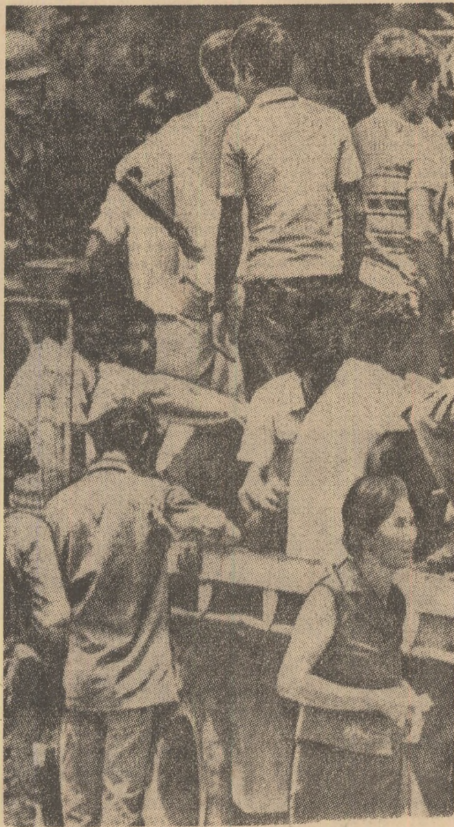
Cuprinși de panică în fața ofensivei forțelor patriotice lonnoștii înrolați cu forța copiilor școlii elementare, lată un aspect de la o asemenea „recrutare forțată” a unor copii de 12-14 ani pe străzile Pnom Penhului.

Consiliul Electoral din Venezuela a anunțat că, la 9 decembrie 1973, urmează să aibă loc alegeri generale pentru desemnarea viitorului șef de stat și reînnoirea Congresului Național. Campania electorală pentru desemnarea candidaților la viitoarele alegeri se află în plină desfășurare. Numărul candidaților la funcția supremă în stat înscrși pe listele electorale este ridică la 14. Partidele de stînga prezintă doi candidați — Jose Vicente Rangel și Jesus Paz Galarraga; partidul de guvernământ Copei l-a desemnat pe fostul ministru de interne Lorenzo Fernandez; formațiunile de centru-stînga mențin candidaturile lui Juan Alberto Solano și Jovito Villalba, iar grupările de dreapta — 9 candidați.