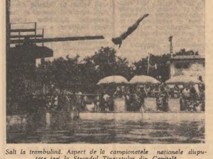
Saltă la trambulină. Aspect de la campionatele naționale disputate ieri la Ștrandul Tineretului din Capitală.

Prin telefon, de la trimisul nostru special Călin Stănculescu. După două zile de întreceri, clasamentele pe echipe ale Jocurilor balcanice de atletism de la Atena.