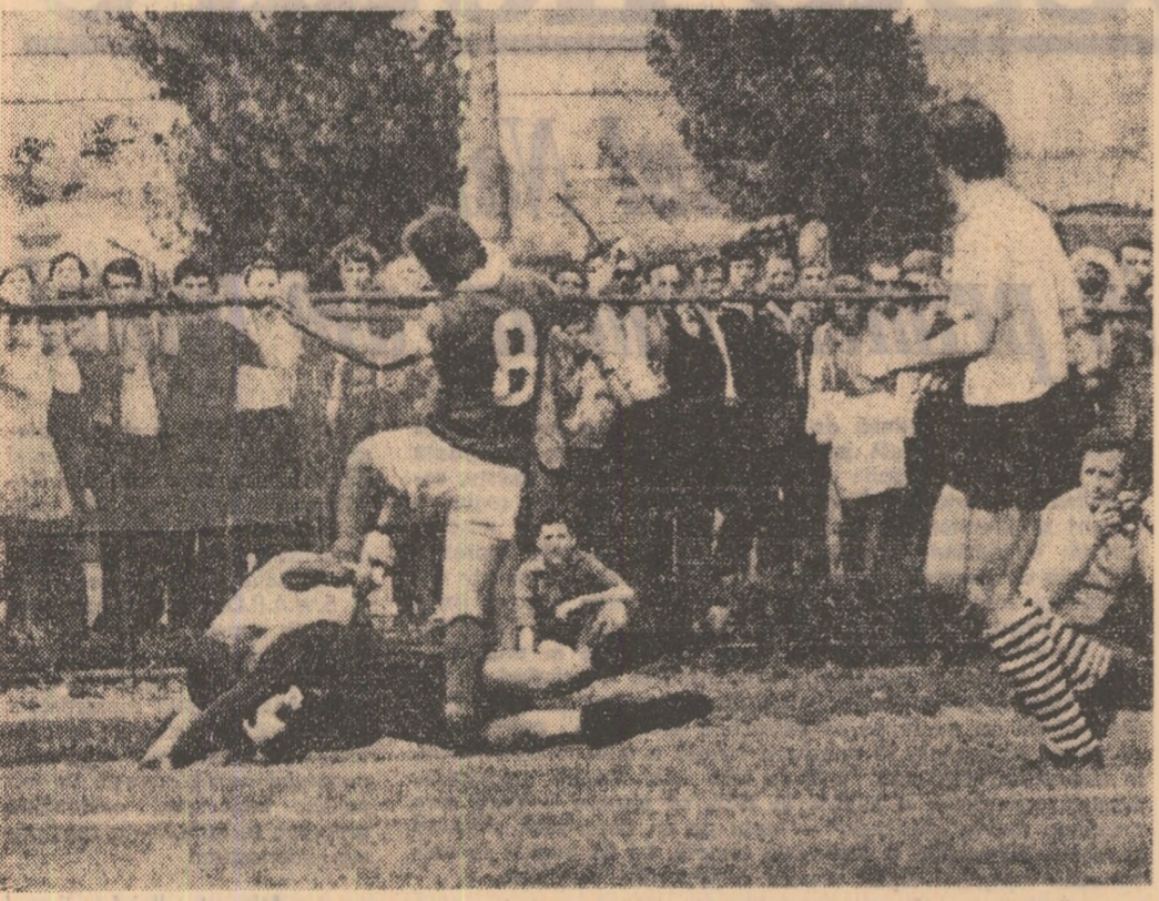
Atac la poarta clujenilor. Fază din partida Rapid—„U” Cluj de pe stadionul Giulești.

Pe pistele de apă ale noii baze nautice din Moscova s-au disputat în zilele finale ale campionatelor europene feminine de canotaj academic, la care au participat sportive din 18 țări.