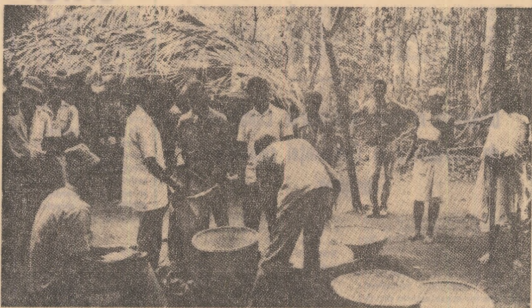
Stringerea și împărțirea recoltei într-un sat din regiunile eliberate ale Guineei (Bissau).