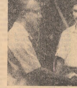
Doi tineri portughezi care au dezerat din rîndurile armatei coloniale, stringîndu-mina lui Amílcar Cabral. Fotografia a fost făcută în una din zonele eliberate din Guinea (Bissau) cu numai cîteva săptămîni înainte de asasinarea de către agenții colonialiștilor a liderului P.A.I.G.C.