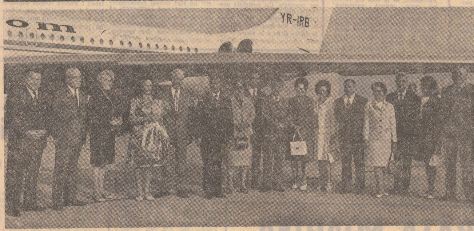
... (Caption text partially obscured)