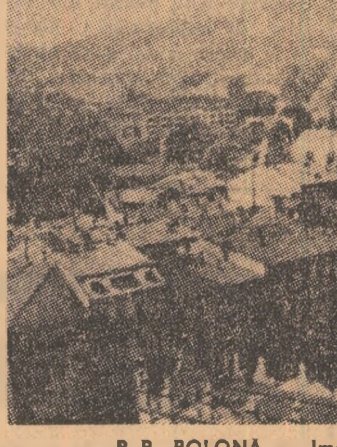
R. P. POLONA. — Imagine din Cracovia.

„Secretul” supraviețuirii acestei republici, derivă și din vitalitatea acestui popor, din ocupațiile străvechi menținute și multiplicare prin secole, din seriozitatea de constructor pe care o vâdește în cele mai diferite prilejuri. Și astăzi, jumătate din populație continuă cultivarea cerealelor, a viței de vie, creșterea animalelor. Alături, s-au dezvoltat întreprinderi de materiale de construcții, fabricii textile și de ciment. Industria hotelieră — care funcționează la înalte cote de confort și civilizată — aduce anual peste 2,5 milioane de vizitatori străini, de pe urma cărora se obțin veniturii însemnate. Un amănunt, nu se pare concludent: în anul 1972, în această republică, am cunoscut un străvechi popor, am călătorit în istorie și în timpurile moderne și am aflat un răspuns.