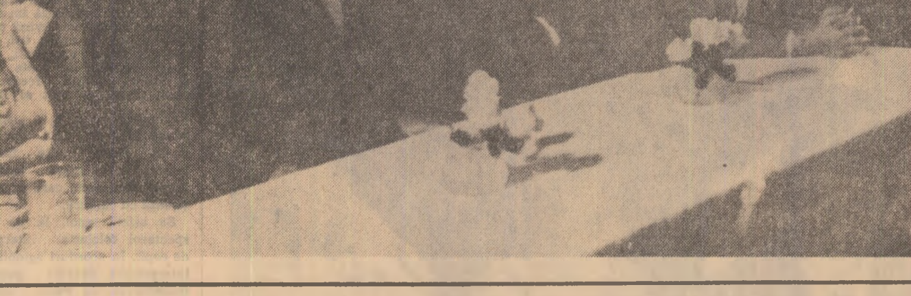
„SCINTEIA TINERETULUI“ pag. 4

FRANCISCO CHAVES (Radio Columbia): Domnule președinte, care sînt obiectivele principale ale vizitei dumneavoastră, nu numai în țara aceasta, ci în America de Sud, ale acestei vizite pe