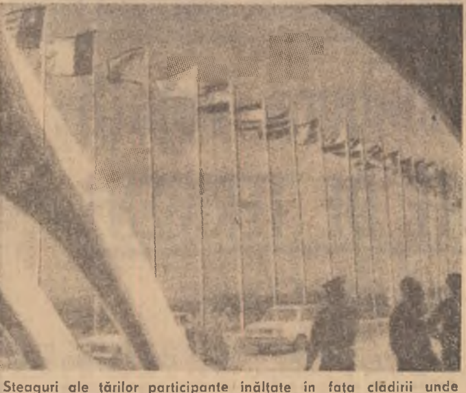
Steaguri ale țărilor participante înălțate în fața clădirii unde se desfășoară reuniunea la nivel înalt a statelor nealiniate.