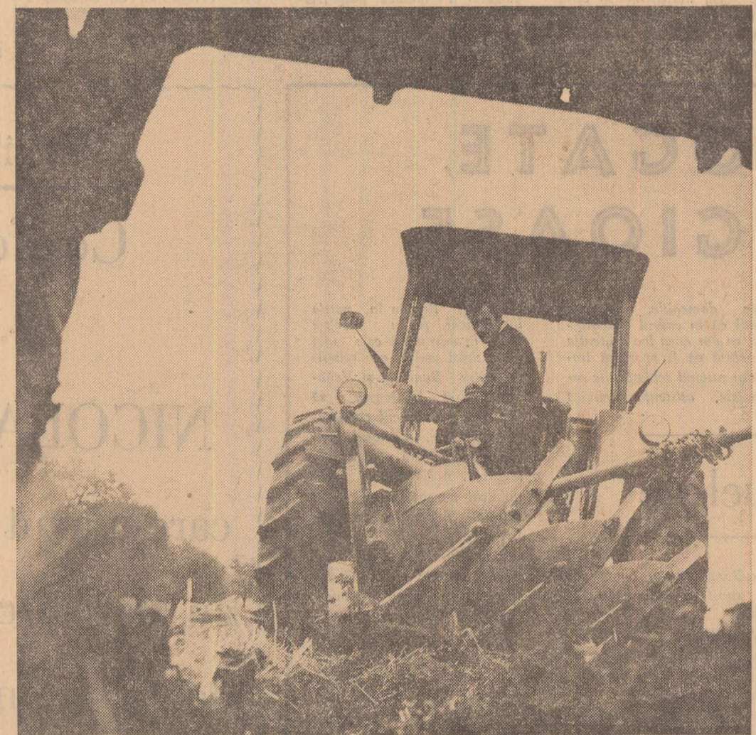
O lucrare de sezon: ARATURILE Foto: GH. CUCU.

BĂRĂGANUL — la ora fierbinte a campaniei! Despre activitatea din acest sezon, reporterii noștri ne relatează aspecte ale activității S. M. A. — Lehliu