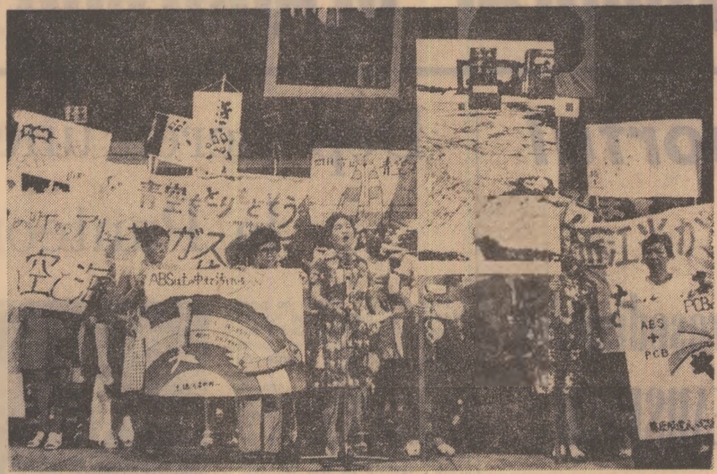
JAPONIA: Participante la cel de-al 19-lea Congres al mamelor, la care s-au ridicat problemele de largiri metodelor de educație a tinerilor, promovării și dezvoltării organizațiilor de femei din Japonia, întăririi păcii în lume, reducerii bugetelor afectate programelor de înarmare.

Existența monstrului subacvatic din lacul scoțian „Loch Ness” care a alimentat, prin diverse ipoteze emise asupra lui, presa occidentală și mai ales pe cea britanică vreme de câteva decenii ar putea fi elucidată de expediția japoneză care își va începe lucrările de explorare la sfîrșitul acestei săptămîni. Cei 8 membri ai expediției vor lucra timp de trei luni, acestora urmînd să li se alăture altele opt persoane. Cercetările prețioase vor începe la 23 septembrie, o dată cu transportarea unui submarin francez de două persoane. În afară de operatorii de pe submarin francez alături de cercetătorii japonezi, la expediție participă trei englezi și un american. Șeful grupului — care nu se îndoieste de existența leghendarului monstru — a declarat că va proceda la aneierea cercetărilor pe baza oficialităților britanice să-i permit să-l captureze. După cum se știe, numeroase expediții organizate pînă în prezent în același scop în continuă, după cum se vede, o fascinantă deosebită vînto cercetătorii de pretutindeni.