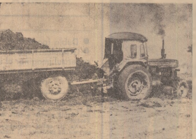
În aceste momente de vîrf ale campaniei de toamnă, meca nizerotei hîmului „Dimbovia” desfășoară largi acțiuni pentru să vadă al calității. Zi-lumină ară, discute și seamănă grîul, transportat în cîmp îngrășimintele naturale.