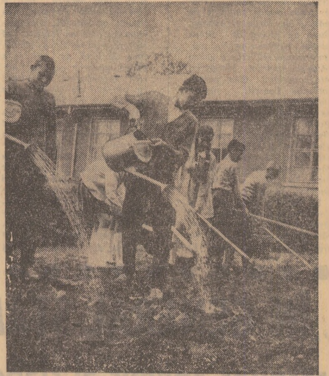
Comuna Romanu, județul Brăila. Elevii, acum în prag de an școlar, amenajează spațiile verzi ale școlii.

Organizator al numeroaselor acțiuni, Consiliul Județean al elevilor din Vrancea se află la sfîrșitul unei etape de lucru, cea a vacanței de vară și în același timp în pragul altelei nu mai puțin importantă: noul an școlar. Localul școlii ce urmează să-l găzduiască în următoarele luni a stat în centrul preocupărilor elevilor de la Școala profesională de construcții și de la Liceul Industrial pentru construcții de mașini din municipiul Focșani. Aceste două obiective au fost decretate pe perioada vacanței de vară șantier de muncă patriotice. Elevii Liceului de cultură generală din comuna Vidra s-au constituit în echipe. Fiecare organizație U.T.C. a fost o echipă. O echipă care zilnic, timp de trei luni, a încercat să-și depășească norma și să depășească celelalte echipe cu care se află în întrecere. Așa se face că tot ce s-a realizat pînă acum pe locul unde se va afla internatul liceului este numai munca uteciștilor de aici. Și nu sînt singurele exemple ale grijii uteciștilor de a-și pregăti din timp școala. În comuna Dumitrești, la Pufești sau la Ba-