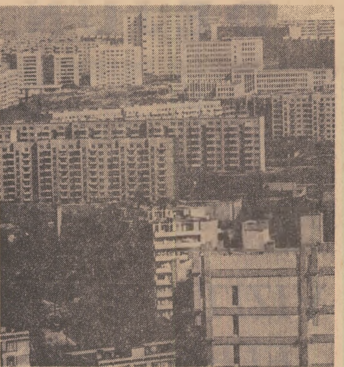
R.P. BULGARIA: Noul cartier de locuințe al muncitorilor complexului industrial „Maritza-Itok din tinutul Radnevo, împrejurimile orașului Staro Zagora.