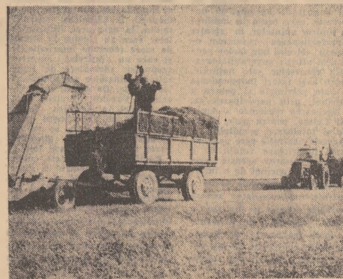
Lucrări de sezon în comuna Mîlcov, județul Vrancea