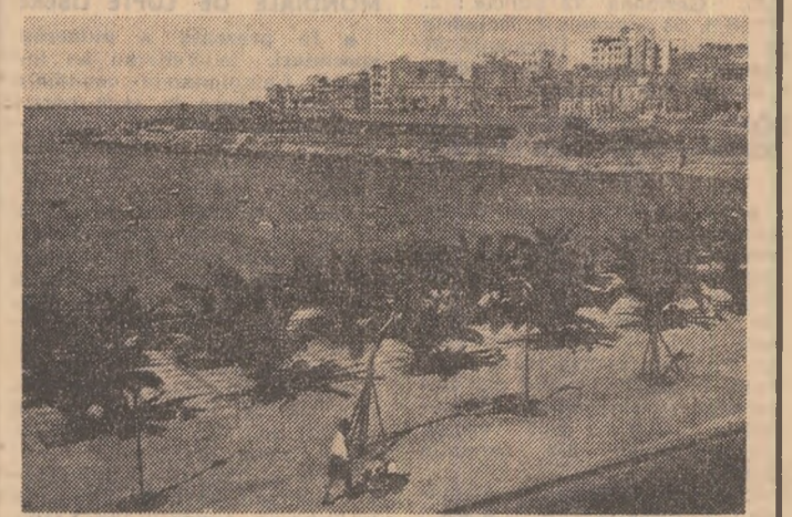
Vedere din Sliema.