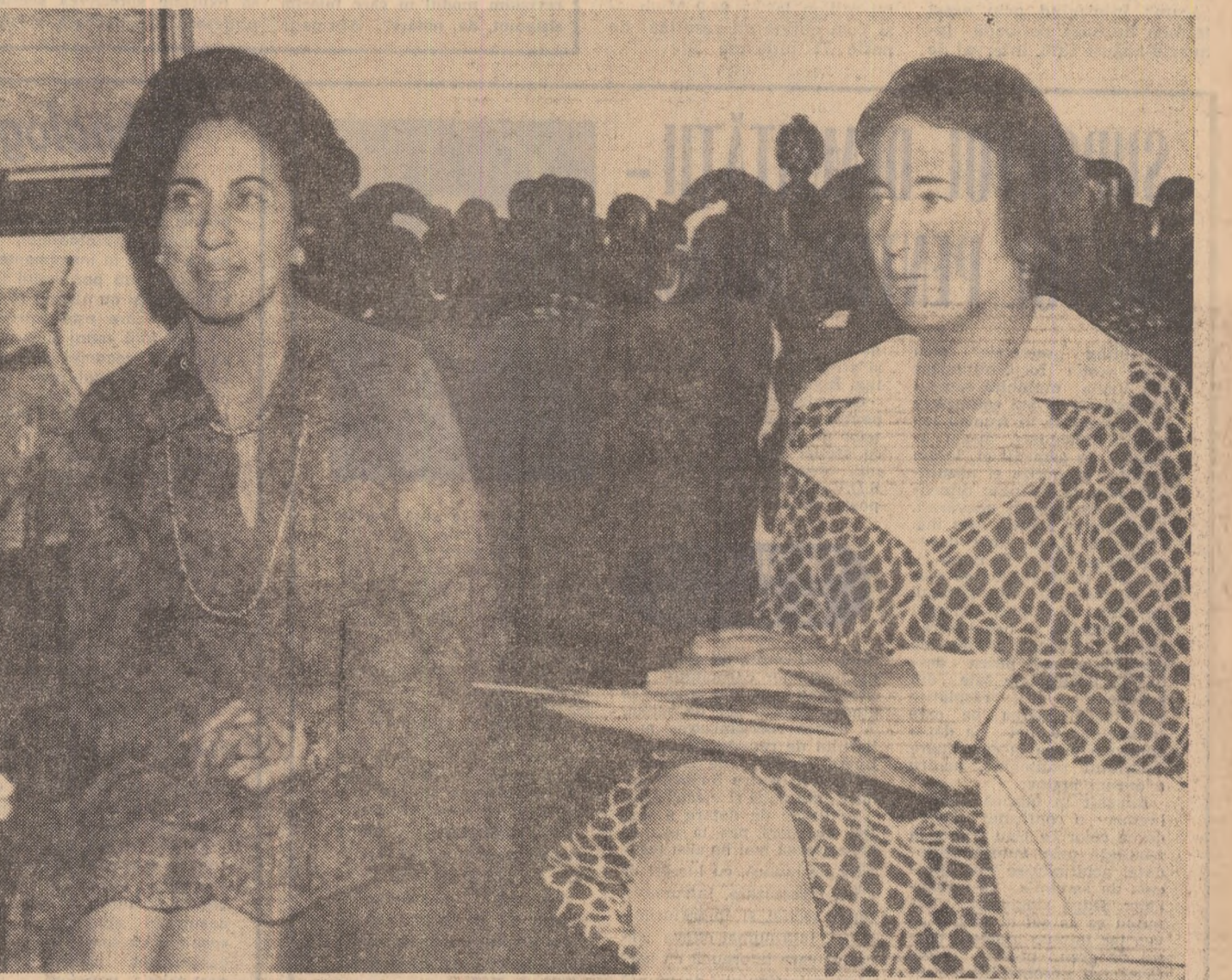
Imagini din cursul întîlnirilor din capitala Republicii Venezuela