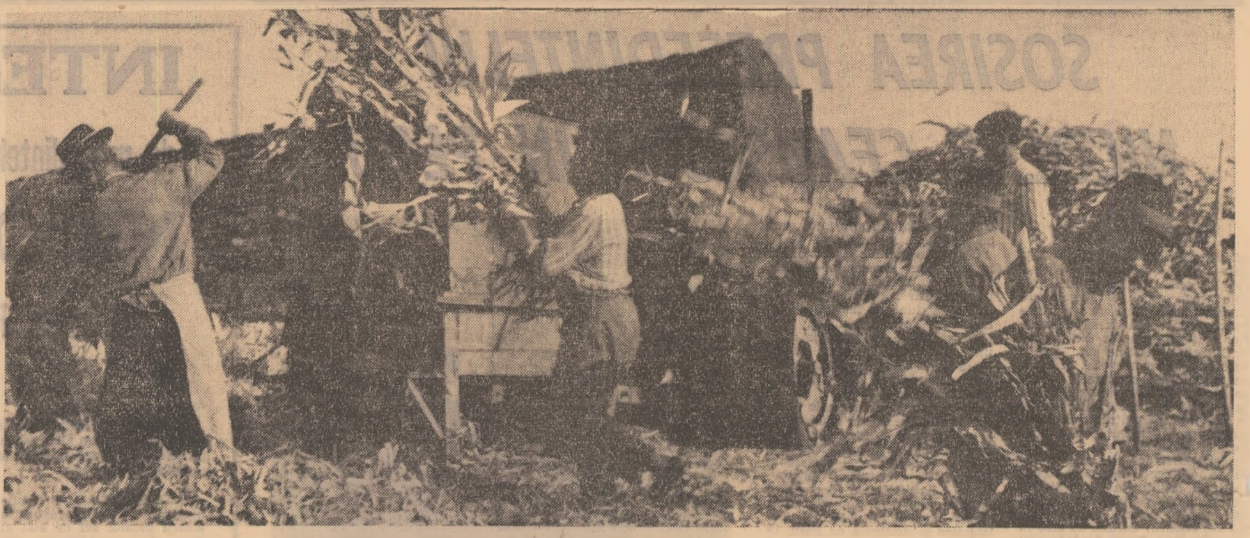
Se munceste cu toate forțele.