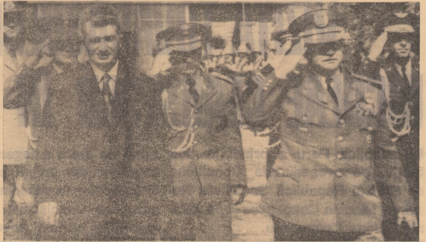
La plecarea din Quito.