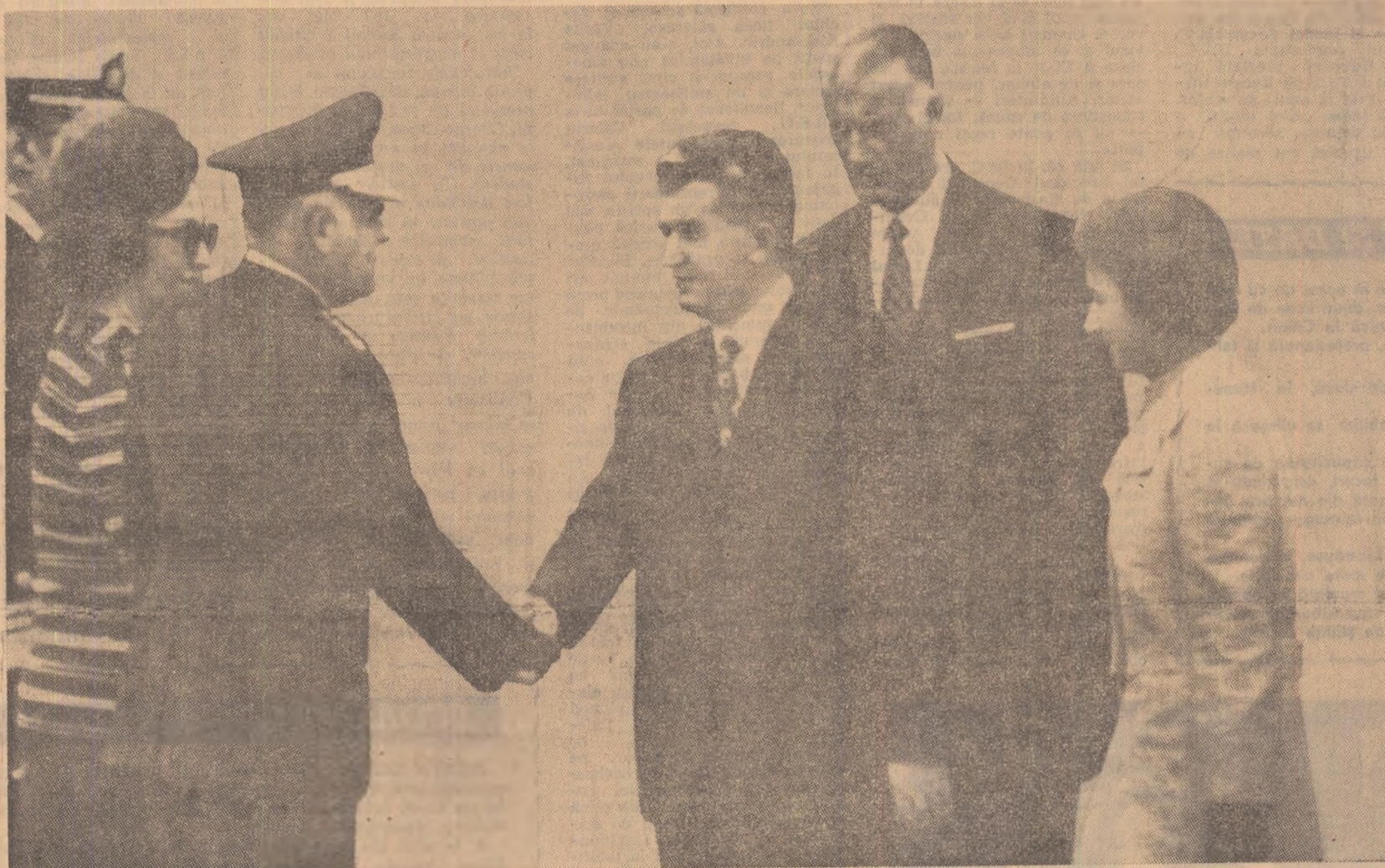
Imagine din prima zi a vizitei la Lima.

Convorbiri între președintele Consiliului de Stat, Nicolae Ceaușescu, și primul ministru și ministru al apărării, Edgardo Mercado Jarrin