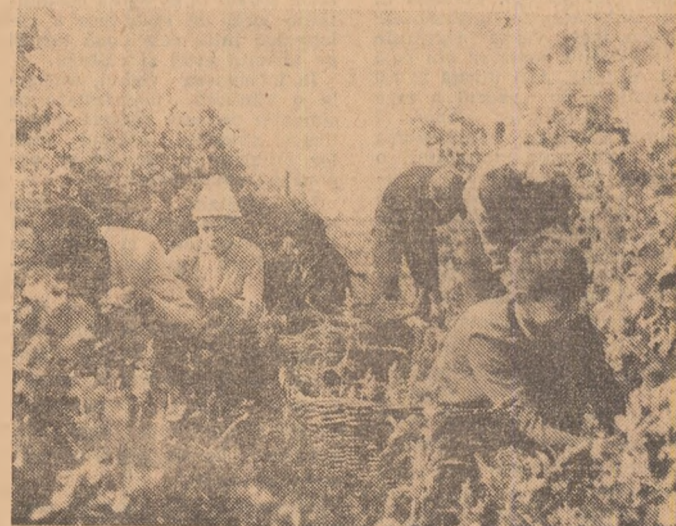
Elevi ai Liceului agricol din Buzău la culesul strugurilor.