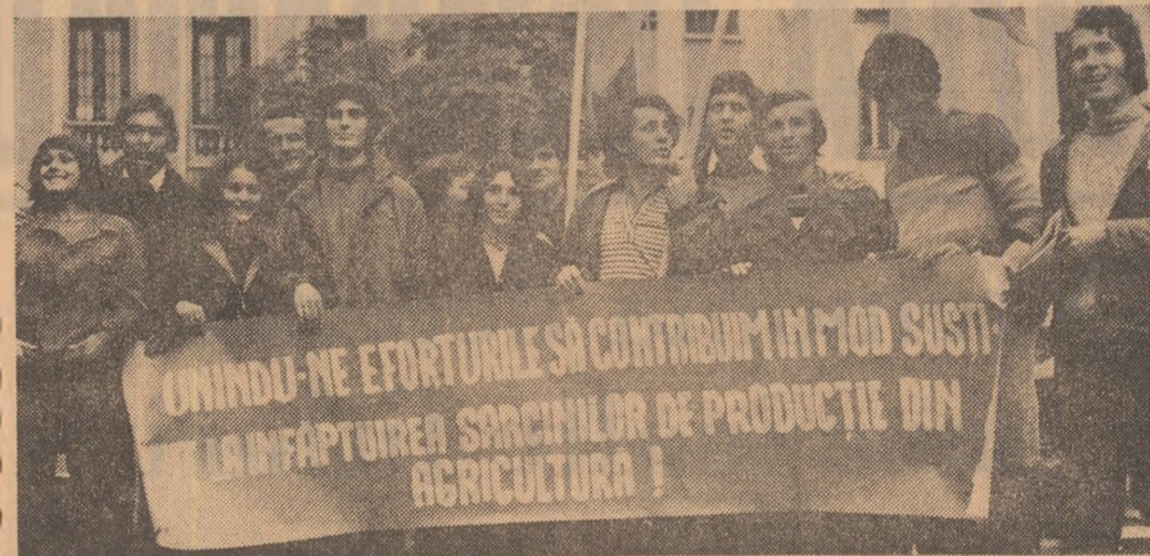
...DINU-NE EFORTURILE SA CONTRIBUIM IN MOD SUSTINUT LA INDEPLINIREA SARCINILOR DE PRODUCTIE DIN AGRICULTURA!

Ieri, la gară și la sedile unor institute de învățământ superior din Capitală, am cunoscut o animație mai puțin obișnuită. Se adunaseră pentru a pleca spre locuri care-i vor găzdui mai multe zile, brigadierii muncii patriotice — studenții care-și înscriu numele în efortul campaniei de toamnă.