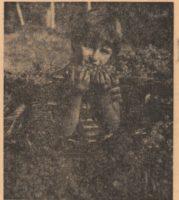
Roadele toamnei — bucuria copiilor.

Cu aceste „antecedente” a început o nouă săptămîină de muncă. Spor la treabă!