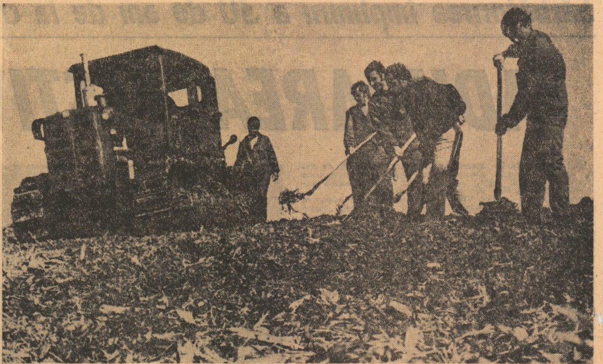
Taxarea și însolozarea furajelor coincide și cu prima lecție practică a studenților din anul I de la Facultatea de medicină veterinară.

A doua zi dimineață, trecînd lărași Borcea, poposind pe „Insula bogăției” simțim tot o mare bucurie. BUCURIA DE A MUNCII.