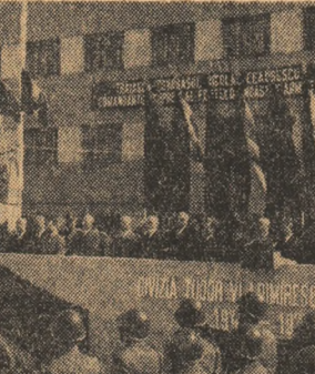
LA CASA CENTRALĂ A ARMATEI

Permiteți-mi să folosesc acest prilej pentru a vă asigura încă o dată Comitetul Central al partidului, Consiliul de Stat și guvernul țării, pe dumnea-voastră personal stimate tovarășe Nicolae Ceaușescu, că armata noastră, devotată trup și suflet poporului și patriei, susține în unanimitate, cu înfăptuire și abnegație, politica internă și externă marxist-leninistă, a Partidului Comunist Român, politică care constituie expresia cea mai înaltă a intereselor supreme ale națiunii noastre socialiste.