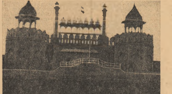
Însemnări de M. RAMURĂ

lor existențe — metamorfoză simbolică pentru o Indie care năzuiește să se adapteze cerințelor timpului modern. Și-au făcut apariția, în deceniile independenței, uzine de dimensiuni impresionante și altele mai mici care amintesc primii pași ai industriei. Uzinele acestea n-au alungat totalmente sărăcia. Dar ele izbutesc să cultive încrederea, să dea speranțe consistente. Ritmul creșterii economice este de 5,5 la sută pe an și, probabil, că în viitorul plan pe cinci ani el va fi păstrat la același nivel. Așteptată este îndreptătația ales către industriile siderurgice, carbonifere, chimică și constructoare de mașini, adică acele domenii capabile