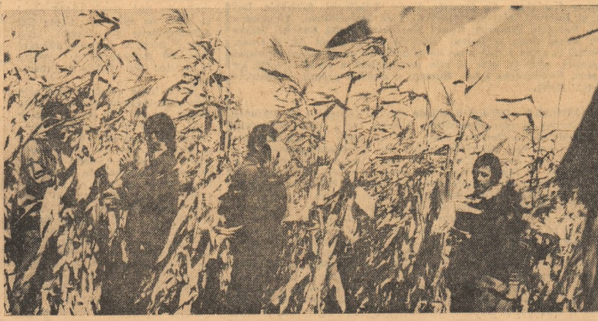
Grupa 1302 de la Facultatea de agronomie la al patrulea rînd de porumb dintr-o singură zi.

În cronica zilnică a campaniei de toamnă care aduce în cămările țării — la chemarea adresată de însuși secretarul general al partidului, tovarășul Nicolae Ceaușescu — bogăția muncii de pe ogoare, serii file de muncă, de hărnicie și entuziasm elevii, studenții și tinerii. Lauda nu le aparține — vine de la beneficiarii. Pe filele carnetelor lor de muncă, care le înlocuiesc deocamdată, pe cele de elevi ori studenți, la bilanțurile pe care le prezintă, beneficiarii — unitățile agricole din întreaga țară — pun note maxime. În fiecare toamnă, notele sînt mai mari. Pentru că în fiecare toamnă, ambiția este și ea mai mare. Dorința entuziastă de a fi de folos sînt în întrecere cu cea ce au realizat astăzi, astăzi primăvară, toamna trecută... În sălile de curs și amfiteatre ori la lucrurile de muncă ale tinerilor stăruie chemarea cîmpului, a toamnei, tradiția muncii. În rapoartele C.C. al U.T.C. în aceste zile sînt cuprinse faptele de muncă ale tinerilor mobilizați de imperativele acestei campanii agricole. Sînt mărturii că prima terție a anului de învățămînt — că aportul lor, al elevilor și studenților este necesar, așteptat — a fost bine însoțită. Și toate acestea s-au transformat într-o mare bătălie a recoltei, la care ei, tinerii școlii și ai amfiteatrelor, n-au vrut să lipsească. Pe harta „strategică” a acestor bătălii, tinerii au reușit care se numesc tabere de muncă ori unit-