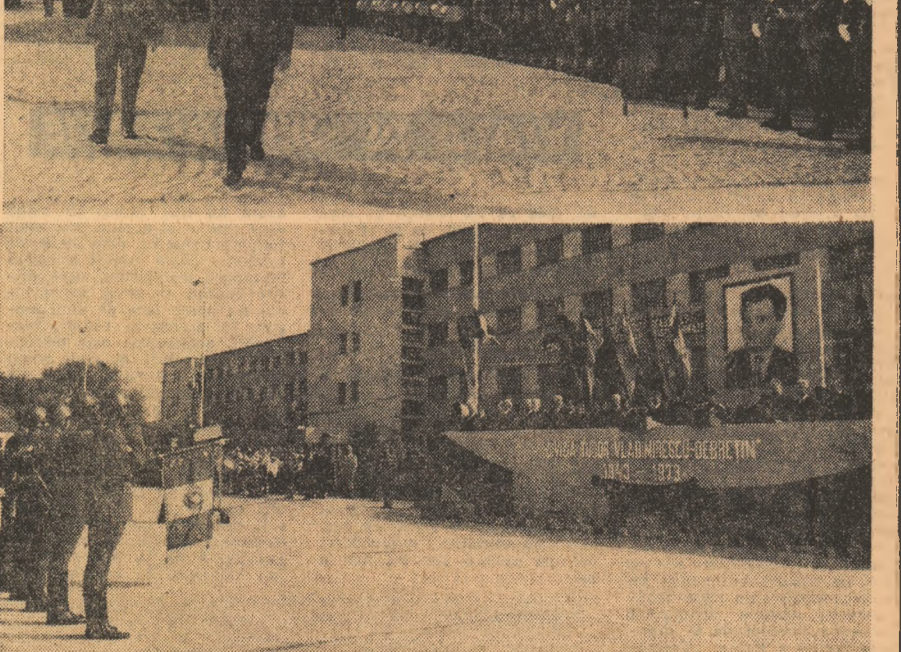
LA CASA CENTRALĂ A ARMATEI

Sînt aici prezenți mai mulți veterani ai acestei mari unități — foști comandanți, șefi de stat major, lucrători politici, care și-au adus contribuția la constituirea și întărirea diviziei, la luptele purtate de această mare unitate, împreună cu celelalte mari unități ale armatei române, cot la cot cu armata sovietică, împotriva trupelor hitleriste. Faptele lor de arme, ca și ale tuturor militarilor români care au luptat pentru eliberarea țării, pentru victoria asupra Germaniei naziste sînt înscrise la loc de cinste în cronică tradițiilor de luptă ale armatei române.