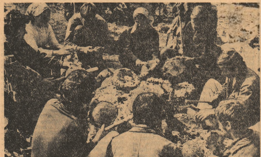
Recoltarea hibridului de floarea-soarelui din cîmpul experimental de la I.C.C.P.T.-Fundulea.