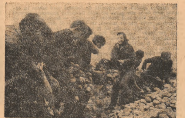
Ajutare de nădejde la recoltatul cartofilor — elevii.