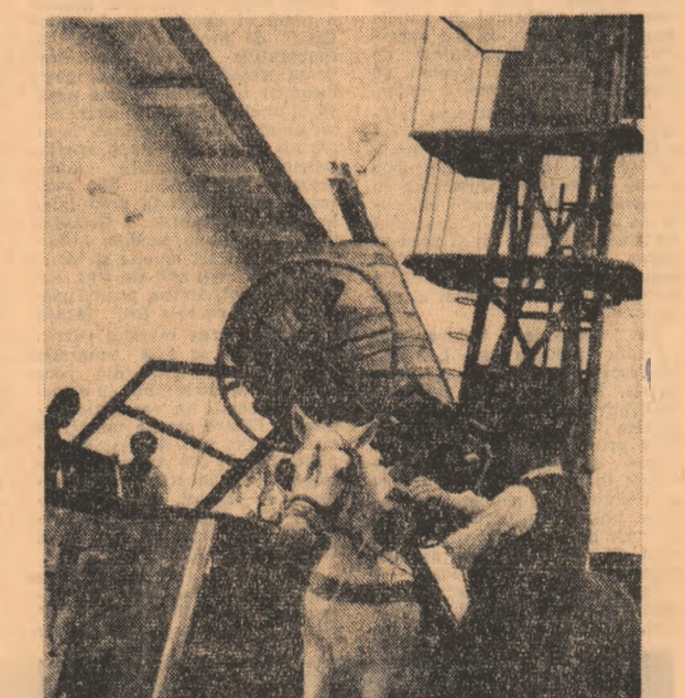
Ultimul drum al strugurilor. Aduși din podgorii cu tradiționalele mijloace de transport, ei cunosc metamorfoza mecanică a decantării în vin. Este ceea ce a tinut să ne convingă și fotoreporterul nostru în instantaneul surprins zilele acestea la Centrul de vinificație din Zărnești, județul Buzău.

Și uite-așa, după ce strugurii erau astfel întorsășiți multe zile, pină se împunertea cea peste luna octombrie, vitile erau coborite în ogrăzi. Venea Lupu de la Bacea cu stocătorul și o noapte întreagă se auzea din fiecare ogradă plînsul mult al strugurilor storși. Butoaiele erau prevăzute cu niște aparate a-nume făcute, menite să-și ușur