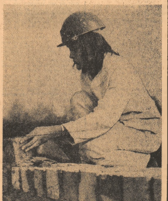
Insemnări de GH. SPINTEROIU

Dar ceea ce s-a făcut la Postdam sau Dedelow, s-a făcut și în alte regiuni din Republica Democrată Germană. „Participă la înfrumusețarea orașelor și comunelor țării!” Sub această lozincă au luat amploare numeroase acțiuni de muncă patriotică. Chiar o privire din fuga mașinii ce ne poartă în direcția Prenzlau (districtul Neubrandenburg) a fost suficientă pentru a ne convinge de rezultatele acestui efort. Cîteva comune și mici orășele pe care trecem ne oferă suficiente exemple convingătoare în ceea ce privește participarea tineretului la întreținerea spațiilor verzi, drumurilor și șoselelor. La Mecklenburg ne reține înnoații care nu odăd s-au bu-