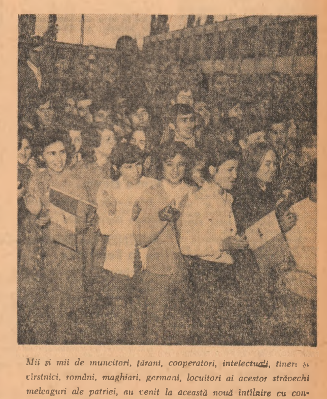
Mii și mii de muncitori, țărani, cooperatori, intelectuali, tineri și cîrșnici, românii, maghiarii, germanii, locuitorii ai acestor străvechi meleaguri ale patriei, au venit la această nouă întâlnire cu conducătorul iubit al poporului nostru.

Făcîndu-se ecoul sentimentelor zeilor de mil de participanți, vorînd în încheiere mitingului, primul secretar al Comitetului județean de partid, a spus: Permiteți-ne, mult iubite tovarăş Nicolae Ceauşescu, să ne exprimăm încă o dată cele mai fierbînte mulțumiri pentru vizita pe care ne-o faceți, pentru îndrumările și prețioasele indicații pe care și de astă dată ni le-ați dat. Aceste indicații pentru organizarea noastră județeană de partid, pentru toți locuitorii, județului, vor constitui o luminată călăuză, un îndemn spre noi realizări în activitatea noastră, pentru transparența în viața a marilor sarcini economice și sociale care ne stau în față în actuala etapă. Ne angajăm, mult stimate tovarăş secretar general, că vom munci cu toată dăruirea, cu tot elanul nostru pentru aplicarea în viață a politicii partidului, pentru edificarea societății socialiste multilaterale dezvoltate în patria noastră. Vă dorim dumneavoastră, iubite tovarăş secretar general, sănătate deplină și multă fericire, putere de muncă sportivă, spre binele partidului, al poporului român, pentru prosperitatea patriei noastre dragi — Republica Socialistă România. Marea adunare populară ia sfîrșit într-o atmosferă de puternice însuflețire. De pretutindeni se aud urări înălțate pentru P.C.R., pentru secretarul său general, tovarăşul Nicolae Ceauşescu.