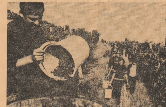
Elevii... horticultorii ai Liceului agricol Drăgășani la o lecție practică ce va deveni în curînd profesia lor de o viață