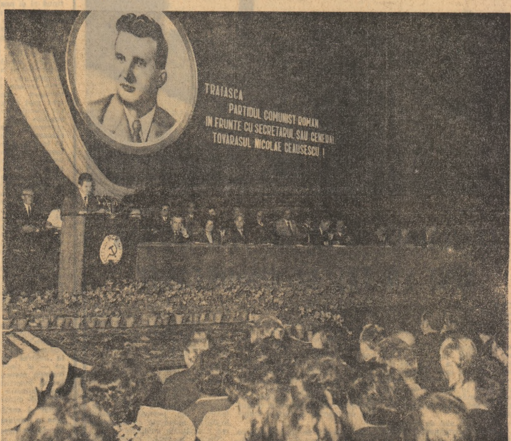
TRATAȘCA PARTIDUL COMUNIST ROMÂN ÎN FRUNTE CU SECRETARUL SAU CENEZĂ TOVARĂȘUL NICOLAE CEAUȘESCU I

„Oamenii muncii trebuie educați în spiritul patriotismului socialist, al hotărîrii de a infăptui politica Partidului Comunist Român de dezvoltare a României socialiste, de a pune totul în slujba ridicării patriei socialiste la un grad cît mai înalt de civilizație materială și spirituală. Totodată, trebuie să educăm masele largi populare, tineretul în spiritul internaționalismului proletar, al solidarității cu popoarele care construiesc socialismul, cu popoarele care acționează pentru dezvoltarea economico-socială independentă, cu toate forțele progresiste, anti-imperialiste, care se ridică pentru dreptate socială și națională, pentru libertate și independență, pentru pace și colaborare internațională”