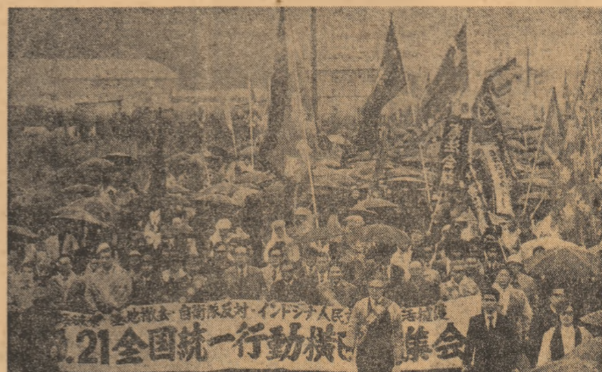
JAPONIA. - Aspect de la o recentă demonstrație a populației din districtul Fussa împotriva bazelor militare americane.

Având în vedere circumstanțele speciale de ordin geografic și de ordin economic (trafic maritim intens, import-export de hidrocarburi, turism dezvoltat), au fost declarate zone speciale: Marea Mediterană, Marea Baltică, Marea Neagră, Marea Roșie și „zona golfului”. De asemenea, delegația română a prezentat propuneri pentru largirea cooperării între statele care vor adera la Convenție. Astfel, s-a menționat necesitatea ca Organizația Consultativă Interguvernamentală Maritimă (I.M.C.O.) să promoveze și să sprijine schimburi de ordin tehnologic necesare aplicării Convenției, să sprijine părțile în realizarea noilor tehnologii și care vor fi dotate navele și să înlesnească un permanent schimb de idei și de informații, să sprijine pregătirea de specialiști în domeniul prevenirii și combaterii poluării apelor. Ca urmare a propunerii delegației române și a altor delegații, a fost adoptat un articol special în convenție, intitulat „Promovarea cooperării tehnice”.