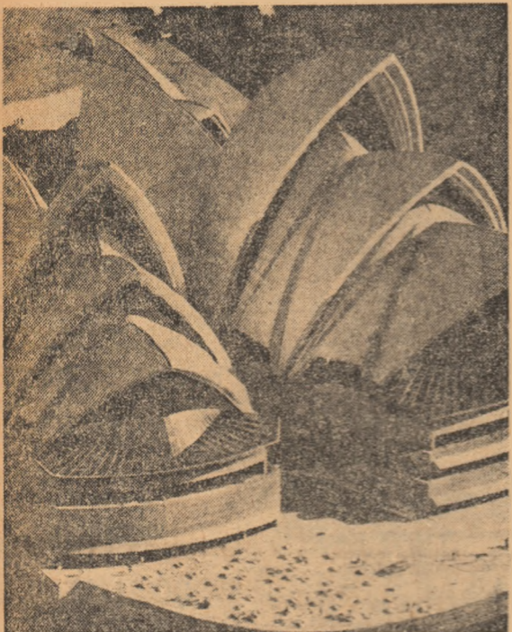
AUSTRALIA. - Noua operă din Sydney, recent inaugurată, una din cele mai spectaculoase construcții de acest fel.

CAIRO 4 (Agerpres). - Un purtător de cuvînt militar egiptean, citat de agenția France Presse, a acuzat forțele israeliene de violențe repetate ale încetării focului, amintind că o plingere în acest sens a fost depusă la O.N.U. El a precizat că, în cursul zilei de sîmbătă, aviația și artileria israeliană au intervenit de patru ori. TEL AVIV 4 (Agerpres). - Un comunicat al comandamentului militar israelian, reluat de agenția Associated Press, informează că forțele israeliene au respins, simțind, o încercare întreprinsă de unități ale armatei a treia egiptene de a lansa un pod peste Canalul Suez. El a menționat că, între forțele israeliene și cele egiptene au avut loc, timp de trei ore, schimburi intermitente de focuri. DAMASC 4 (Agerpres). - Agenția TASS informează că, la invitația guvernului sirian, la Damasc a sosit Vasili Kuznetsov, prim-adjunct al ministrului afacerilor externe al Uniunii Sovietice. WASHINGTON 4 (Agerpres). - Departamentul de Stat al S.U.A. a anunțat că între secretarul de stat american, Henry Kissinger, și ministrul de externe egiptean, Ismail Fahmy, aflat de câteva zile într-o vizită la Washington, a avut loc, simțind, o nouă întrevedere. WASHINGTON 4 (Agerpres). - Primul ministru al Israelului, Golda Meir, care întreprinde o vizită oficială în S.U.A., s-a întâlnit din nou, în seara de 3 noiembrie, cu secretarul de stat american, Henry Kissinger - informează agenția Associated Press. Convoierile au fost consacrate situației din Orientul Apropiat.