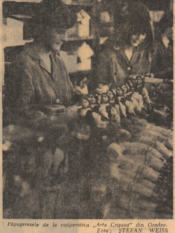
Păpușeresele de la cooperativa „Arta Crișana” din Oradea.