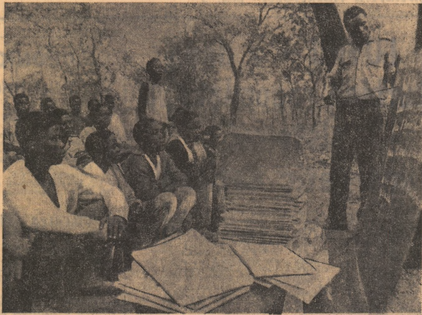
MOZAMBIK. — Aspect de la unul din cursurile de alfabetizare organizate în zonele eliberate din provincia Tete.

Purtătorul de cuvânt al Ministerului de Externe al Republicii Vietnamului de Sud a dat marți publicității o declarație, în care a condamnat administrația saigonese pentru raidurile aeriene întreprinse la 12 noiembrie asupra zonelor Thien Nghon și Xa Mat, din provincia Tay Ninh. Declarația menționează că, în cursul acestui raid, au fost ucise 600 de persoane civile precum și importante distrugerii materiale — arată declarația, care cere părții saigonese să înceteze neîntârzia acțiunile împotriva zonelor eliberate și să se conformeze acordurilor încheiate cu privire la Vietnam.