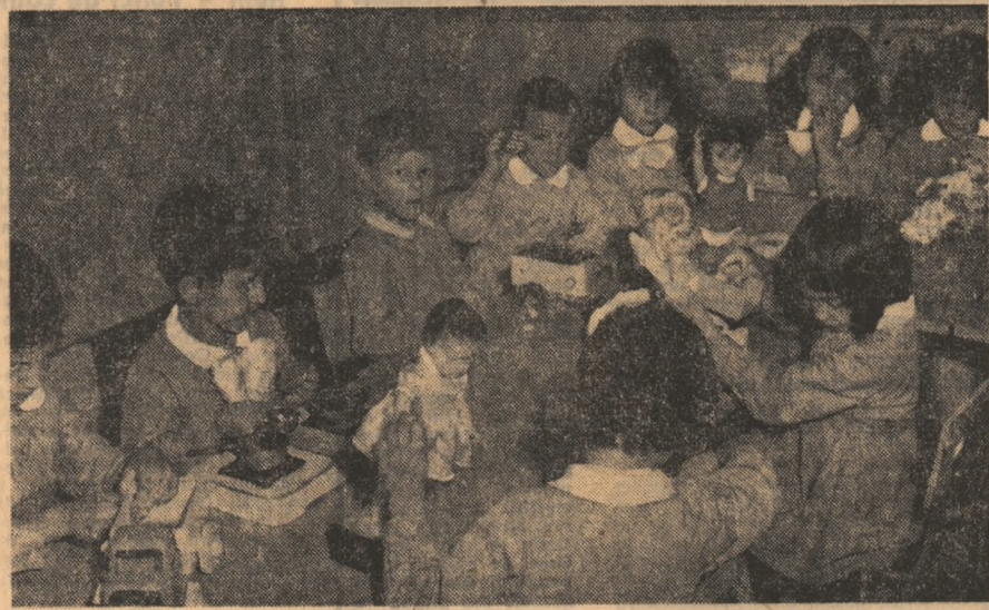
Printre beneficiarii noii unități pentru preșcolari din sectorul 8 al Capitalei.