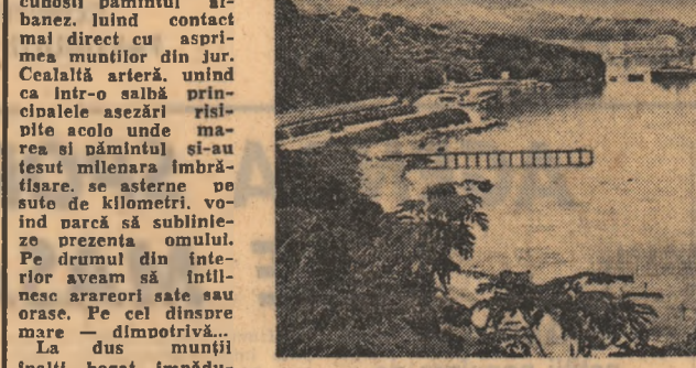
Insemnări din R. P. Albania

elevi, studenți, muncitori, cooperatori agricoli, asediau reducere calcarosă. Pantele pe care vegetația era aproape inexistentă se terasau, construindu-se pe ele adevărate alei cu mășini și portocale. Aici, la Saranda, numărul puleților plantați trecea de 40.000. La Vlora, mai spre nord, pe adâncimea terenului însumând 1200 hectare, au apărut întinse plantații de smochini, măști, portocale, lămi. Citeva zile mai târziu de pe terasa Casei de cultură a tineretului din Durres gazdele își arăta o largă întindere de pământ smulș vitregilor naturii. Pe cele 5000 de hectare se semănase grâu. La Maliq, în câteva kilometri de Korca, prin truda oamenilor, dispăruseră mlaștinile. Acum pe aceste roșii terenuri se află o fermă de stat. Asemenea eforturi sunt evidente la scara întregii țări. În anul care a trecut de la instaurarea puterii populare în Albania, au fost recuperate și ameliorate 220.000 de hectare, suprafață echivalentă cu 80 la sută din totalul pământului cultivat în anul 1938.