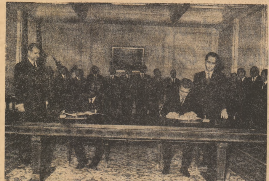
Vineri, 16 noiembrie, a avut loc semnarea Declarației comune cu privire la vizita în Republica Socialistă România a delegației Partidului African al Independenței din Guineea-Bissau și Insulele Capului Verde, condusă de tovarășul Aristides Pereira, secretar general al P.A.I.G.C.