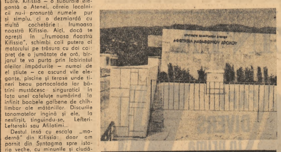
Insemnări din Grecia de VIOREL RABA.

Destul înscău de esca „modernă” din Kifissia: doar am pornit din Syntagma spre istoria veche, cu minunile și ciudătenile ei. Zece kilometri mai departe, la Ekali, se intră în oastestrada de Salonik Toboganului autobanelor te înghețe din nou făcându-te, curind, să te întrebi: încotro? la ce bun toată goana asta? spre unde? Pe prima la dreapta schimbi nebunia aterei cu șase benzii, pe a șasea îngustă și cam pustie, unde, cu oarecare luare aminte, două mașini mai mici pot trece una pe lângă cealaltă. Bucă te poartă spre Kapandriti și șezărele de basm numite Kalameo, cu pădurea de pini din o pierdere mării, care adăpostește ruinele de la Amphipolis. Asadar, întințire cu mitologia. Amphipolis, căruia Zeus i-a dăruit nemurirea, a fost unul din cei șapte eroi de Argos care s-au ridicat împotriva Thebei. Adorat ca un zeu, Amphipolis era socotit posesor al unor miraculoase puteri de tămăduire. În vâstul său sanctuar, în afara renumitului teatru, exista un portic la care pelerinilor li se vindeau toate rețele. N-am