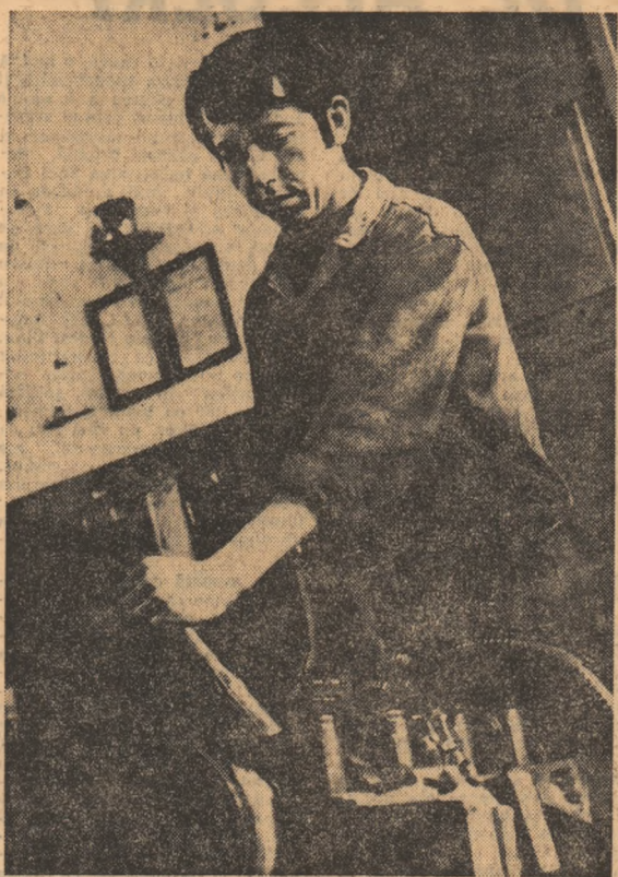
La S.M.A. Cluj se lucrează la montarea și sudarea mașinilor agricole