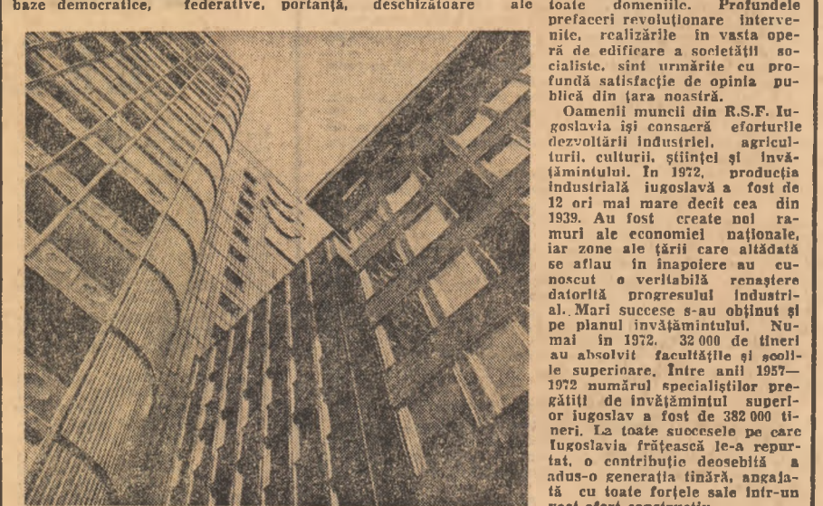
Imagine din Ljubljana.

Poapele Iugoslaviei sărbătorește azi un moment de seamă al istoriei lor. Cu trei decenii în urmă, în cadrul sesiunii de la Iaije a Consiliului Antifascist de Eliberare Națională a fost creat nou stat Iugoslav pe baze democratice, federative,