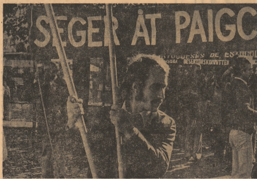
SUEDIA. — Aspect de la o demonstrație de solidaritate cu lupta de eliberare a popoarelor din coloniile portugheze, desfășurată la Stockholm.