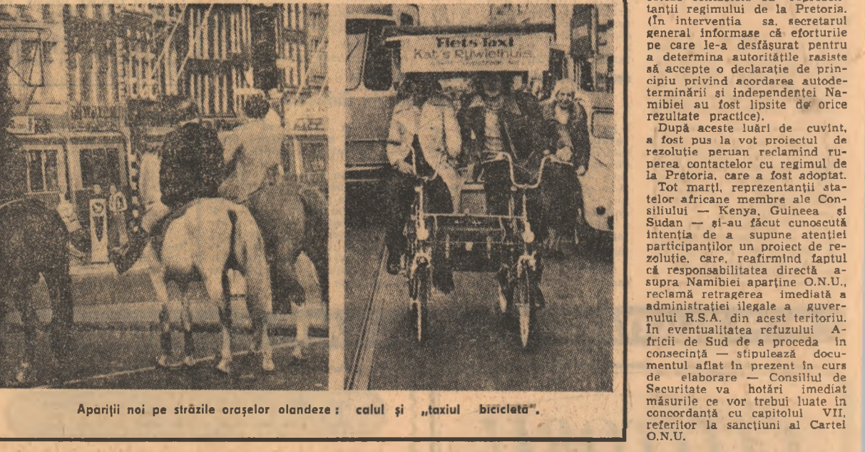
Apariții noi pe străzile orașelor olandeze: calul și „taxiul bicicleta”.