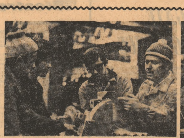
FOTOREPORTAJUL ZILEI de LIDIA POPESCU și VASILE RANGA